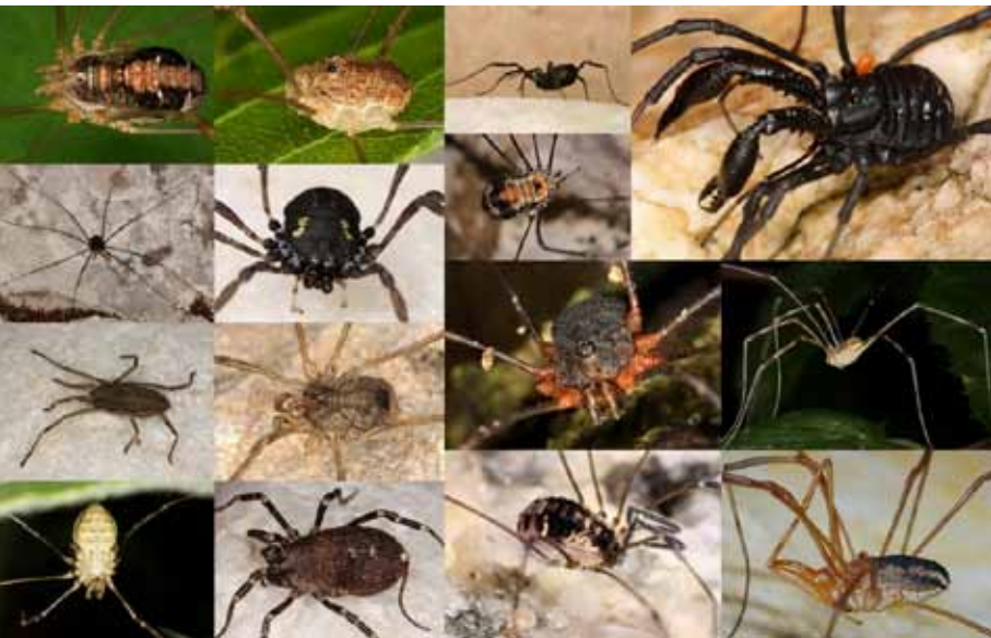
Die Vielfalt der heimischen Weberknechtfauna.

Ein kleiner, knopfförmiger Körper mit unendlich langen Beinen – so präsentieren sich die »klassischen« Weberknechte. Abgeflacht und mit Erdkrümelchen bedeckt – bei Brettkänkern fällt es schwer, sie mit ihren langbeinigen Verwandten in Beziehung zu setzen. Weberknechte sitzen an Hauswänden, an Felsen, unter Steinen, aber die meisten Arten leben versteckt in der Bodenschicht. Sie sind Räuber, und kleine Gliederfüßler sind ihre bevorzugte Beute. Ihre Nahrung finden sie auf abgestorbenen Pflanzenteilen, die von anderen Tieren gefressen und zersetzt werden. Mit wenigen Ausnahmen sind Weberknechte nachtaktiv.