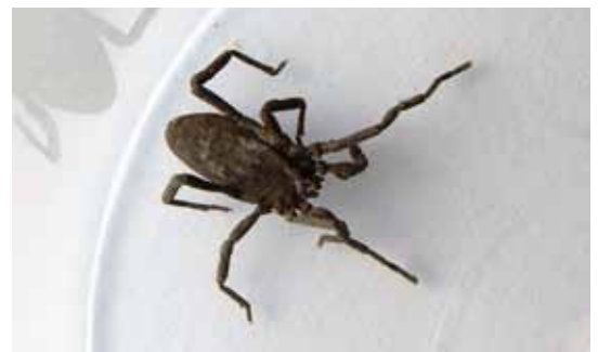
Die gut getarnten Brettkäunker ( Trogulus spp.) sind auf dem Erdboden nur schwer zu entdecken.