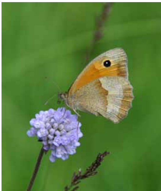
Das Grosse Ochsenauge braucht zur Flugzeit ein gutes Angebot an Nektarpflanzen wie sie blütenreiche, magere Wiesen bieten.