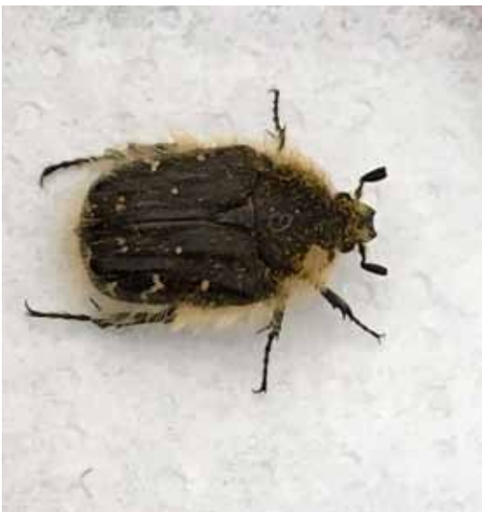
Der Zottige Rosenkäfer ist eine wärmeliebende Art und in Mitteleuropa selten anzutreffen.

Einzigartig war die Beobachtungsmeldung eines Monarchfalters in Sulzberg-Thal im August letzten Jahres. Offensichtlich handelte es sich hierbei um einen Terrarienflüchtling – von dieser Art kennt man sonst das wundersame Naturschauspiel, wenn Millionen von Individuen sich auf einen Transkontinentalflug quer durch Nordamerika begeben. In Göfis tauchte der seltene Zottige Rosenkäfer und in Sulz eine verschleppte Gottesanbeterin auf.