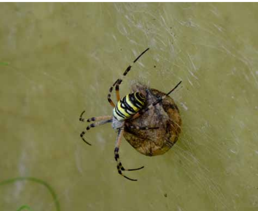
Die Wespenspinne schützt mit einem Kokon die darin abgelegten Eier.