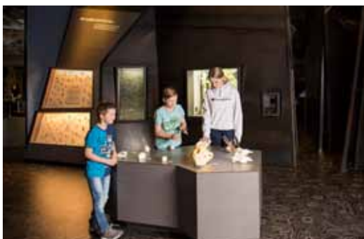
Der »Lebensraum Gebirge« wurde mit zahlreichen interaktiven Stationen neu gestaltet.