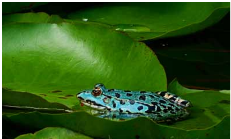
Diesem normalerweise grün gefärbten Wasserfrosch fehlen die gelben Farbzellen in der Haut. Er erscheint daher blau.