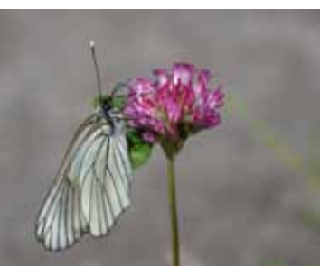
Dieser Schmetterling (Baum-Weißling) ist gut als ein Vertreter der Weißlinge erkennbar.