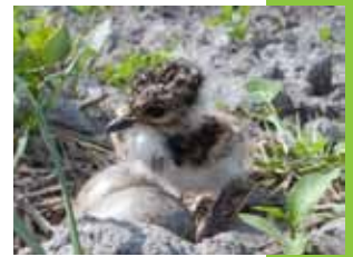
Junger Kiebitz aus dem Auer Ried