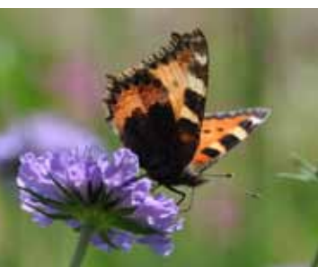
Der Kleine Fuchs ist wie zahlreiche andere Schmetterlingsarten auf Brennnesseln als Raupennahrung angewiesen.