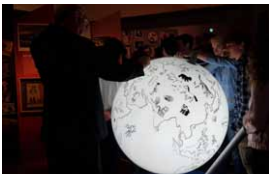
Die Sonderausstellung »Weiß der Geier!« ist noch bis September in der inatura zu sehen.