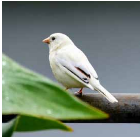
Als Folge eines Gendefekts fehlen bei diesem Sperling die farbstoffbildenden Zellen.