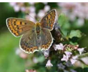
Die Raupe des Braunen Feuerfalters frisst an Sauerampfer und benötigt Wiesen, die in nicht zu kurzen Zeitabständen geschnitten werden.