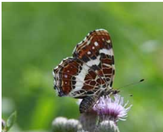
Das Landkärtchen erinnert mit seinen Mustern und Linien auf der Flügelunterseite an eine Landkarte.