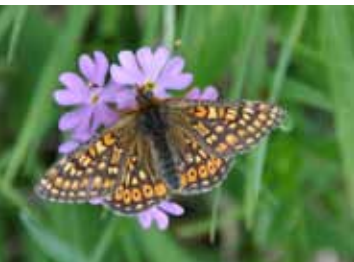
Der seltene Skabiosen-Scheckenfalter lebt in Feuchtgebieten und ist als Art der Flora-Fauna-Habitatrichtlinie streng geschützt.

Sie sind weniger geworden, unsere Tagfalter. Auch wenn Kleiner Fuchs und Zitronenfalter als erste flatternde Frühlingsboten das endgültige Ende des Winters verkünden, dürfen wir uns nicht täuschen lassen: Immer seltener können wir in den Tallagen Vorarlbergs Schmetterlinge antreffen, und oft sind es nur einzelne Tiere, die sich von uns beobachten lassen. Wie anders war dies doch in unserer Kindheit, als die Wiese neben dem Elternhaus voll war mit Insekten! Was gab es da nicht alles an »Krabbelzeugs« zu entdecken. Und es war noch eine richtige Wiese, mit Margeriten und Klee, mit Wiesen-Bocksbart und Kuckucks-Lichtnelken – kein Vergleich zu den totgemähten und überdüngten grünen Agrarwüsten unserer Tage! Doch wo damals Wiesen waren, stehen jetzt Häuser. Zierpflanzen sorgen zwar für etwas Farbe im Garten, aber es dominiert der gepflegte, blumenfreie Rasen. Wie kann sich hier noch ein Schmetterling wohlfühlen?