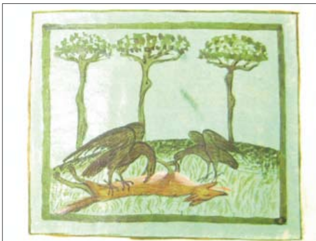
Hans Vintler: Pluemen der Tugend, (Ausschnitte), Foto: TLM