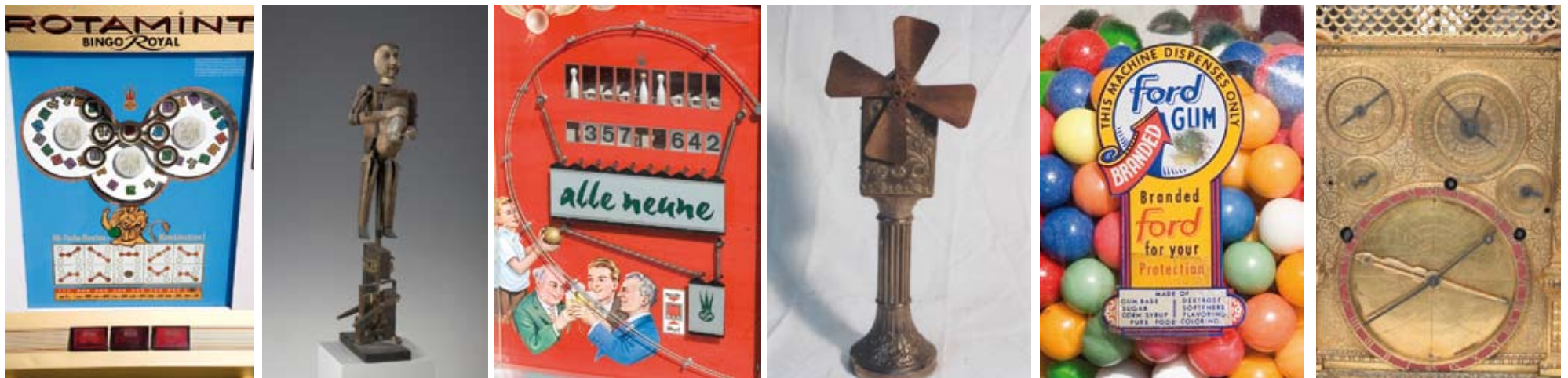
Rotamint, 1975, Scheiben-Glücksspielautomat, Telfs, „The Rolling Jukeboys“, Foto: Frischauf

Die Schau beschäftigt sich einerseits mit der historischen Entwicklung von Automaten und präsentiert ihre Vielfalt, stellt sie aber andererseits auch in einen kultur- und sozialgeschichtlichen Kontext. Damit ist eine Anknüpfung an die in den vergangenen Jahren im Zeughaus gezeigten Ausstellungen zur Alltagskultur gegeben.