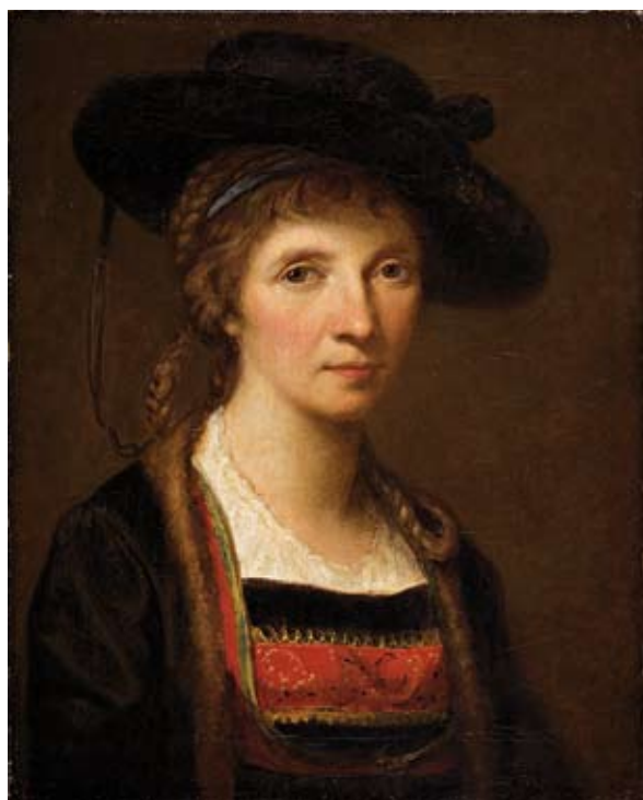
Angelika Kauffmann, Selbstbildnis in der Tracht der Bregenzwälderin , TLMF, Foto: Frischauf/TLM Carl Moser, Bretonisches Fischermädchen , 1906, TLMF, Foto: TLM