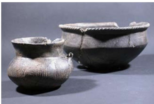
Freilegung von mannslangen Steinkisten.