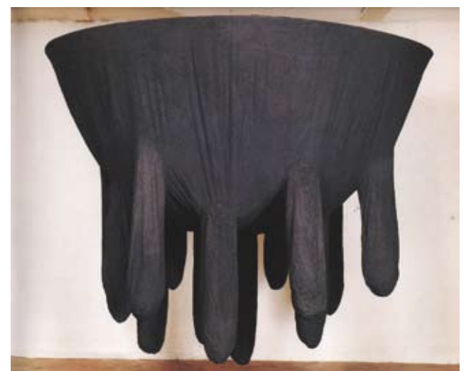
Alfons Walde, Holzzieher, 1932, Privatbesitz

Zur Ausstellung wurde ein umfangreiches facettenreiches Rahmenprogramm – neben Führungen, wird es auch Filmvorführungen und Konzerte geben – erarbeitet.