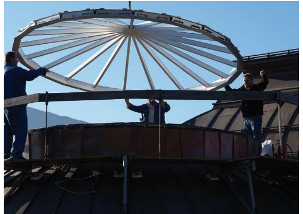
Verschönerungen: Das Ferdinandeum hat seit September eine neue Kuppel, die das Dach des Museums ziert, auch der Treppenaufgang ist nun wieder in schönster Pracht.

Jahresbeitrag € 30,-, Studenten € 10,-, Institutionen, Gemeinden € 100,-, Familien (+ Kinder bis 14 Jahren) € 50,-