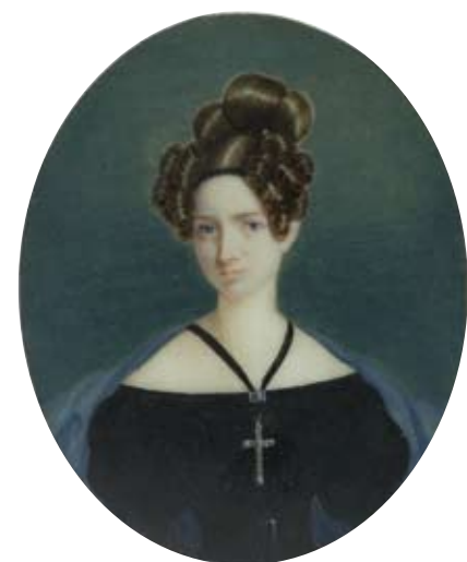
Peter Paul Kirchebner, Antonia Kirchebner , 1840, TLMF Foto: TLM

Dampflokomotive des k.k. priv. Südbahngesellschaft, 19. Jh., TLMF, Foto: TLM