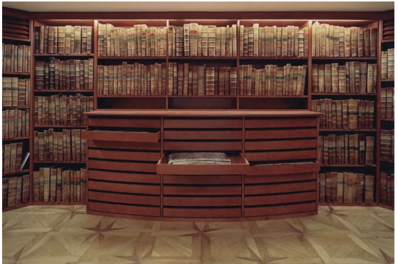
Ansicht Dipauliana, Bibliothek Ferdinandeum