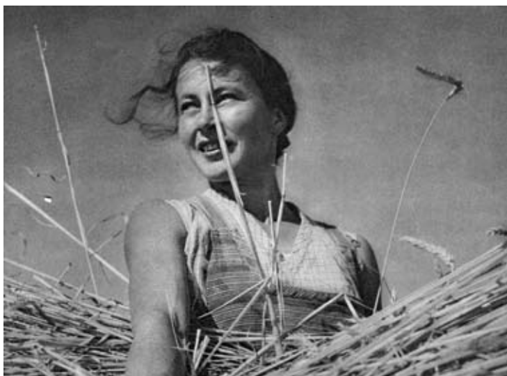
Bernhard Huwiler, Mission Kuh , 1999 Videostudie