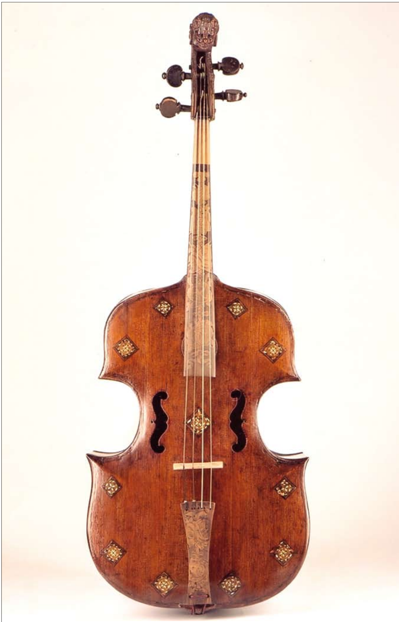
Russo-Viola da gamba, Foto: Frischauf / TLM

Ein Musikinstrument kann viel mehr sein als ein Werkzeug ( instrumentum ) zur Tonerzeugung: Nicht nur ein Gebrauchsgegenstand, sondern ein Kunstwerk für sich, ein Objekt, in dem sich persönliches Prestige des einstigen Auftraggebers oder Besitzers spiegeln und besondere Wertschätzung für die Tonkunst.