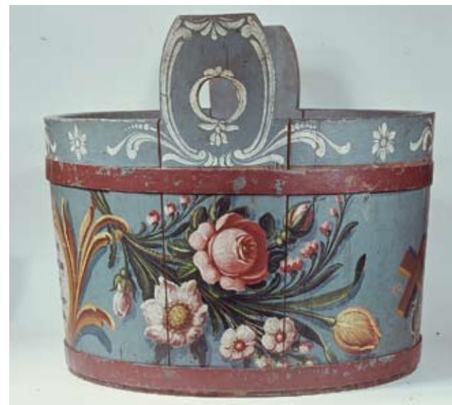
Schaffl, Fichtenholz, die Wandung mit 2 Blumensträußen, den Symbolen von Glaube, Hoffnung und Liebe und eine Rokokokartusche auf blauem Grunde bemalt, welche folgenden Spruch enthält: „Ich stehe da den ganzen Tag Und keiner kommt der trinken mag. Wenn in mir voll Weine wär So würd ich jeden Tage lerr.“ Michael Erhart 1864

liche Wechsel, der die Kultur des Alpenraums ursprünglich geprägt hat, war ja die Quelle der Eigenart der Volkskultur in den Alpen. Er korrespondiert auch mit dem Kirchenjahr und dem Typus des Klostersgartens, den der Kreuzgang umschließt. Dieser „Bauernkalender“ soll dem Besucher den Schlüssel zum Verständnis der einzelnen Sammlungen und deren Entwicklung geben. Ein besonderes Kapital bildet die Hofkirche. Sie verweist auf die zweite Dimension Tirols, dessen habsburgische und kaiserliche Vergangenheit. In der bisherigen Situation wird den Besuchern aus aller Welt aber diese Information nicht vermittelt. Um das Verständnis für den Rang dieses Kunstwerks zu erhöhen wird der Besucher zuerst eine kurze Einführung in einer Preshow erhalten und dann durch den Kreuzgang in die Kirche geführt. Der Museumsbesucher wird dabei vom letzten didaktischen und technischen Stand der Museumsvermittlung betreut werden. Dass dieses Museum auch eine neue Eingangssituation braucht, ist klar. Dazu wird eine großräumige Umgestaltung des Platzes vor der Hofkirche unausweichlich sein und auch die Servicebereiche (Kassa, Shop, Café) werden neu gruppiert und gestaltet werden. Selbstverständlich wird auch für eine durchgängige Behindertengerechtigkeit Sorge getragen werden.