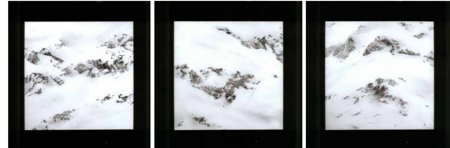
Werner Barfus, Ohne Titel (aus der Reihe „Wüste Landschaften“), 2006, Acryl auf Glas, je 90 x 90 cm.

2007 hat der aus Schladmigstammende und in Ratingen (D) lebende Künstler Werner Barfus in der Galerie Notburga Werke der 2006 entstandenen Serie „Wüste Landschaften“ ausgestellt. Dabei handelte es sich um ausschließlich in Schwarz-Weiß gehaltene Phantomlandschaften – Landschaften, die in der Wirklichkeit nicht existierten und nur in der Phantasie der Betrachter als solche gedeutet werden. Was aussieht wie Ausschnitte aus unberührter Natur, wie lebensfeindliche Zonen, in denen Schnee und Eis dem Einfluss des Menschen bisher getrotzt haben, ist bei näherer Betrachtung eine sorgfältig austarierte Gemengelage in Schwarz-Weiß: Sichtbare Pinselstriche, wolkig getupft. Der Künstler lässt dabei das Material für sich arbeiten und versteht es, mit einer großen Perfektion Effekte zu zaubern: schwarze Farbfelder brechen durch das Weiß wie Felsformationen, die durch den Schnee sichtbar werden. Drei dieser „gefakten“ Schneelandschaften in Acryl auf Glas im Format 90 x 90 cm hat der Künstler, dessen Vater Innsbrucker ist, dem Ferdinandeum geschenkt.