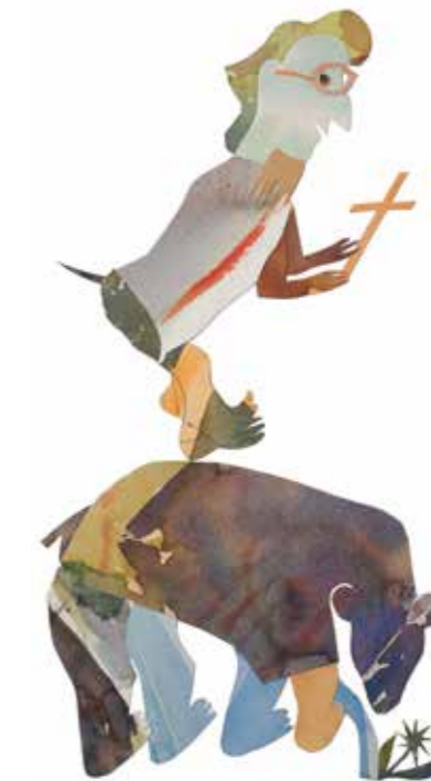
Reiner Schiestl, Hl. Romedius mit Bär, Collage, 2012

Die künstlerische Umsetzung erfolgte in Bildcollagen und begleitenden Erzähltexten auf der Basis von überlieferten Legenden. Das Zerschneiden seiner alten Landschaftsaquarelle für die Collagen beschreibt der Künstler augenzwinkernd als „angewandte Metapher für das Leid der Folter“, deren viele Varianten in den Legenden so grenzenlos fantastisch erzählt werden. Durchleben Heilige wie durch Wunder gar mehrere Folterqualen – etwa die Hl. Kosmas und Damian, die von Flammen, Steinen