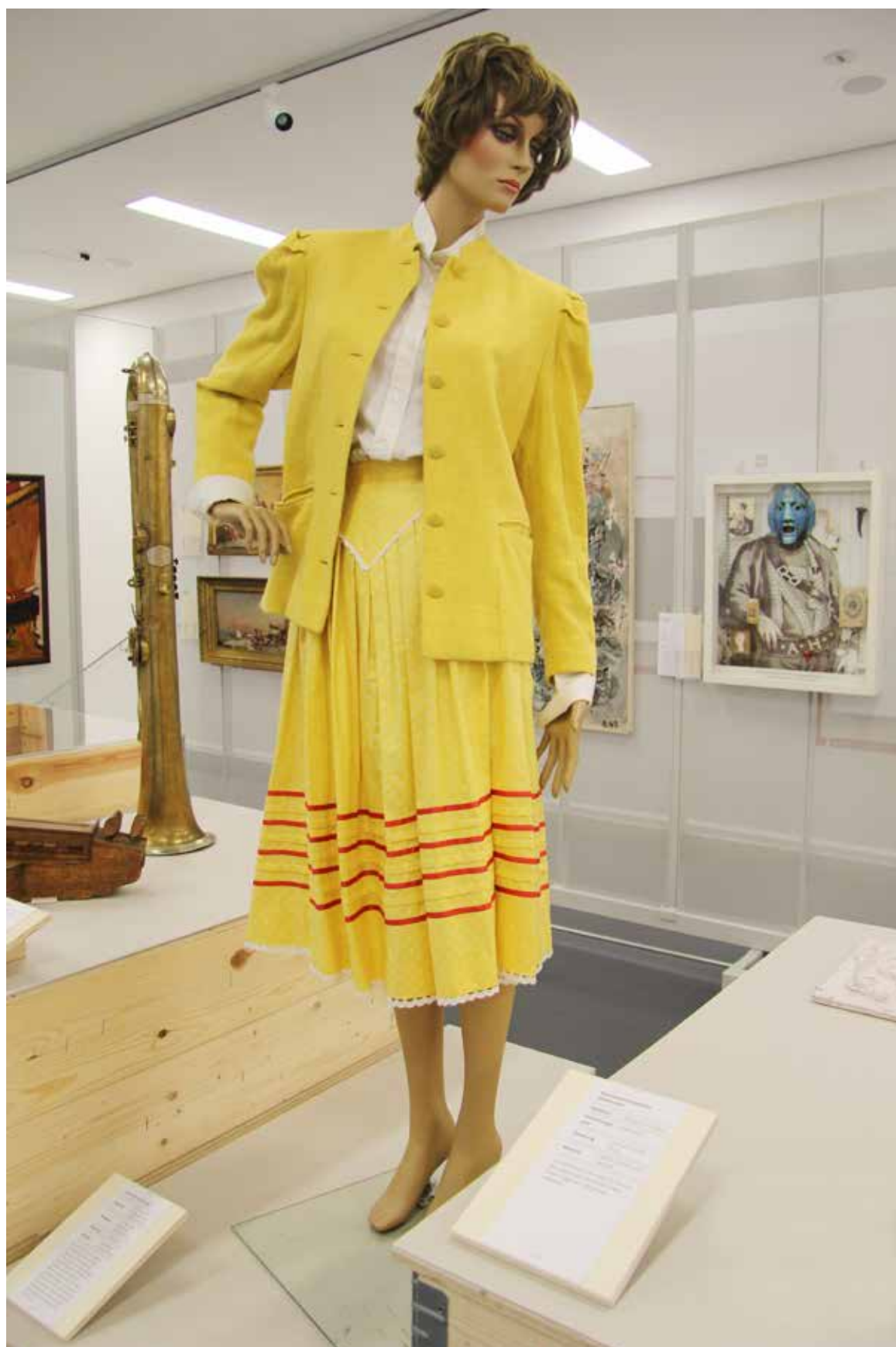
Uniform einer Stewardess der Tyrolean Airways, 1980–1991. Historische Sammlungen, Inv.-Nr. Uniform/356.