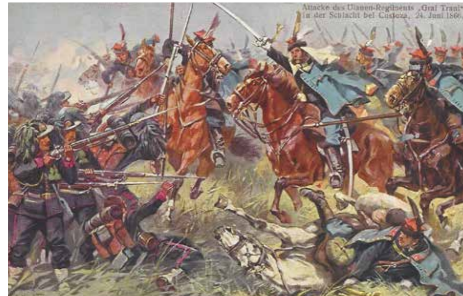
Der Einsatz von Kavallerie in der Schlacht bei Custozza am 24. Juni 1866.

Der Begriff Kavallerie, im deutschen Sprachgebrauch erstmals 1569 schriftlich erwähnt, bezeichnet die Reiterei der Landstreitkräfte, welche zu Pferde mit Blank- und Handfeuerwaffen kämpfte. Aufgrund ihrer Mobilität und Durchschlagskraft gehörte sie schon in der Antike neben der Infanterie zu den wichtigsten Truppengattungen und behielt diese Rolle bis in die zweite Hälfte des 19. Jahrhunderts. So blickte auch die österreichische Kavallerie, böhmische Dragoner, Husaren aus Ungarn und galizische Ulanen, vielfach auf eine lange Tradition zurück, die sich in ihrem Selbstverständnis, aber auch in prächtigen Uniformen widerspiegelt. Die Ausstellung im TIROL PANORAMA mit Kaiser-