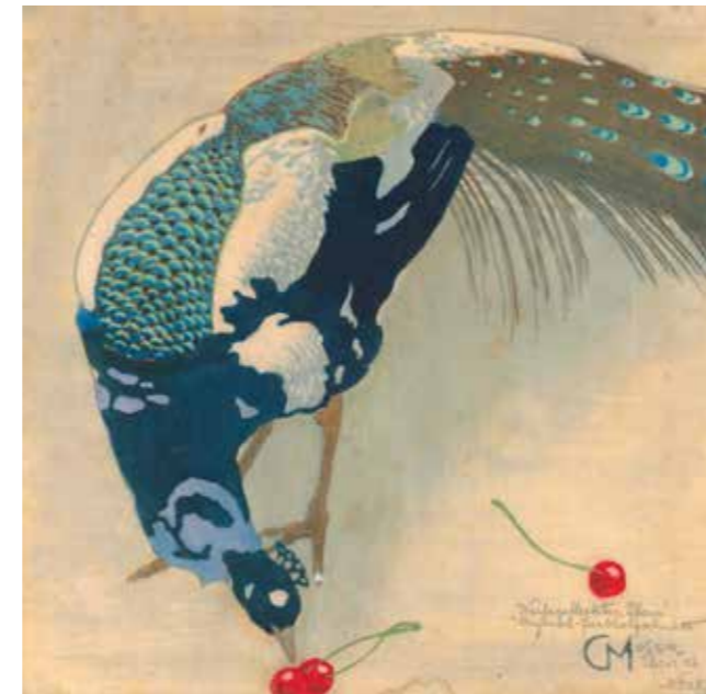
Carl Moser, Weißgefleckter Pfau, 1906, Farbholzschnitt aus der Sammlung Wilfried Kirschl.

Der Begriff Kavallerie, im deutschen Sprachgebrauch erstmals 1569 schriftlich erwähnt, bezeichnet die Reiterei der Landstreitkräfte, welche zu Pferde mit Blank- und Handfeuerwaffen kämpfte. Aufgrund ihrer Mobilität und Durchschlagskraft gehörte sie schon in der Antike neben der Infanterie zu den wichtigsten Truppengattungen und behielt diese Rolle bis in die zweite Hälfte des 19. Jahrhunderts. So blickte auch die österreichische Kavallerie, böhmische Dragoner, Husaren aus Ungarn und galizische Ulanen, vielfach auf eine lange Tradition zurück, die sich in ihrem Selbstverständnis, aber auch in prächtigen Uniformen widerspiegelt. Die Ausstellung im TIROL PANORAMA mit Kaiser-