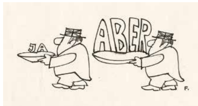
Paul Flora, England nähert sich der EWG (Ausschnitt), erschienen in der ZEIT, 8.7.1966; Sammlung Klocker Stiftung

Bis 26. März werden BesucherInnen der Ausstellung „Paul Flora. Karikaturen“ im Ferdinandeum auf eine spannende Zeitreise durch die 1960er Jahre mitgenommen. Zwischen 1957 und 1971 zeichnete der Tiroler Aus-