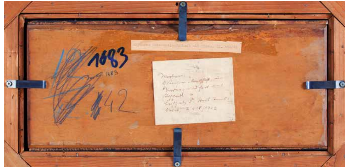
Informationen auf der Rückseite (wie Kleber, Stempel, Notizen, Sammlerzeichen etc.), wie auf dieser Erwerbung aus dem Wiener Kunsthandel, sind wichtige Hinweise auf mögliche Vorprovenienzen. Jeder Hinweis kann hilfreich sein.

Aufgabe der Provenienzforschung ist es, die Herkunftsgeschichte von Museumsobjekten möglichst lückenlos zurückzuverfolgen und zu ermitteln, ob sich unter den früheren Eigentümern Verfolgte des NS-Regimes befunden haben, denen ihr Kunstbesitz abgepresst oder geraubt wurde. Die Provenienzforschung im Bereich der Erwerbungen aus dem Kunsthandel gewinnt zunehmend an Bedeutung. Die Tiroler Landesmuseen erforschen sukzessive ihre Sammlungsbestände in systematisch-wissenschaftlicher Form in Hinblick auf ihre Herkunft und machen die Ergebnisse dieser Recherchen auf ihrer Website öffentlich.