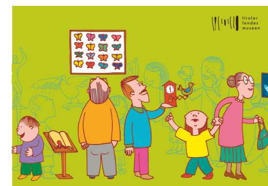
Subjet zum Angebot. Illustration: Birgit Raitmayr/pixlerei.at

Es gibt Anlässe wie etwa ein Geburtstagsjubiläum, eine Erstkommunionfeier, den Besuch von Freunden mit Familie und ähnliche, an denen nach einem gemeinsamen Programm für Jung und Alt gesucht wird. Für solche