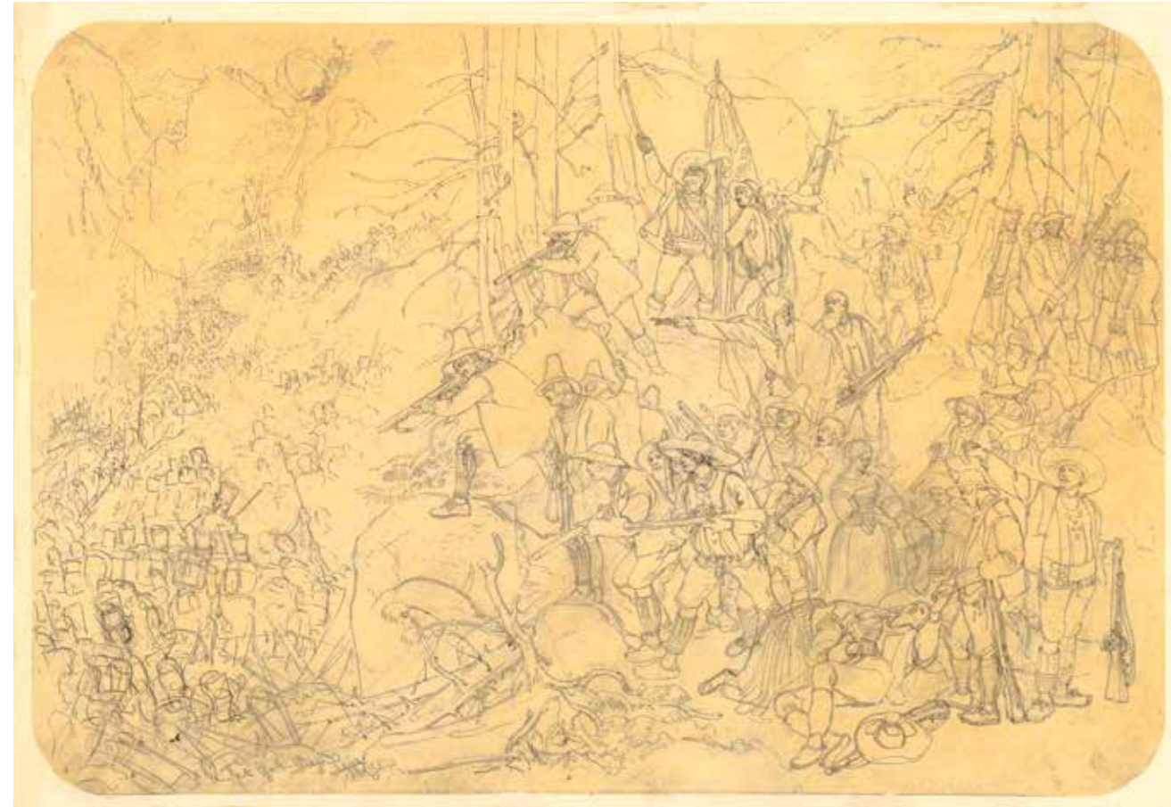
Diese Federzeichnung wurde 1940 über die Galerie L.T. Neumann in Wien erworben. Recherchen zu dieser Arbeit sowie über die Wiener Galerie sind im Laufen.

Im Sinne der gesetzlichen Grundlagen für die Rückgabe von Kunstgegenständen werden in den Tiroler Landesmuseen sämtliche Erwerbungen seit 1933 auf ihre Provenienz hin überprüft. Denn trotz der teils umfangreichen Restitutionsen in der Nachkriegszeit und einiger Restitutionsen in den vergangenen Jahren sind immer noch Objekte vorhanden, deren Herkunftsgeschichte es zu klären gilt, um die Rechtmäßigkeit des Eigentums zu prüfen. Die besondere Problematik besteht hier insbesondere darin, dass in der NS-Zeit ein bedeutender Teil