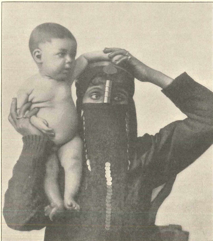
Ägyptisches Kind der Jetztzeit.

Die Köpfe der altägyptischen Mumien tun dar, daß jetzt, nach 5 bis 6 Jahrtausenden, die Ägypter sich nicht verändert