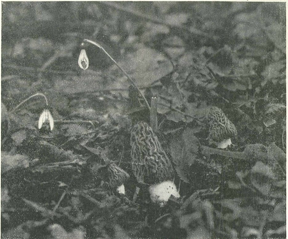
Frühlingsverpeln in der Lobau