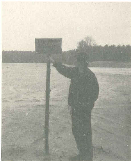
Baugelände des AKW Klempicz am 27. April 1989: »Betreten verboten«. Zwei Tage später wurde der Bau eingestellt.

Vielleicht wird aus dem AKW Zarnowiec – mit nachhaltigem Druck der Bevölkerung – doch etwas anderes als ein AKW, z.B. ein Gaskraftwerk. Noch ist es dazu nicht zu spät. Und dies wäre gewiß sinnvoller, denn das AKW Zarnowiec hat schon jetzt den Kosenamen »Zarnobyl«, hat man doch als Konsequenz des Unfalls von Tschernobyl vor ca. zwei Jahren eine Überprüfung des Baus durchgeführt und prompt etwa 70 Baumängel festgestellt.