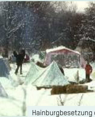
Hainburgbesetzung durch önj -Gruppen (Silvesternacht 1984-85) bei -13 Grad (li.). In den Nationalparkgemeinden der Hohen Tauern versuchte Prof. Stüber, die Menschen von der Bedeutung eines NP zu überzeugen (re.).