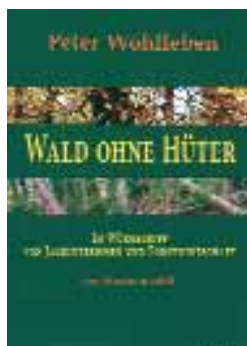
Peter Wohlleben. Adatia Verlag, 136 Seiten, ISBN 978 3 940 610 18, € 12,90