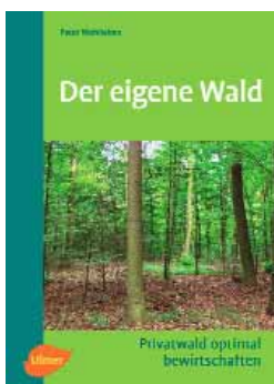
Peter Wohlleben. Ulmer Verlag, 2. akt. Auflage 2014, 152 S., ISBN 978 3 8001 8299 2, € 24,90

Einer der letzten Urwaldriesen fällt rauschend zu Boden. Mit ihm verschwinden zahlreiche Tier- und Pflanzenarten. Schachbrettartige Plantagen mit fremden Baumarten beanspruchen plötzlich tausende von Quadratkilometern. Großmaschinen, die das Holz ernten, hinterlassen auf Jahrzehnte verwüsteten Boden. Insekten, die in diesen tristen Monokulturen siedeln, werden mit der Giftspritze bekämpft. Urwaldvernichtung in der Dritten Welt? Nein, es handelt sich um Deutschland. Der Autor benennt die erschreckende Misswirtschaft, die im Namen des Bürgers und Steuerzahlers und unter dem Etikett des Umweltschutzes ausgeübt wird. Seinen Optimismus hat er dennoch nicht verloren, denn er setzt auf politische Beeinflussung.