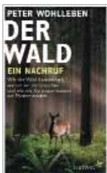
Peter Wohlleben. Ludwig Verlag, 256 Seiten, ISBN 978 3 453 280 41 0, € 20,60

Privatwaldgrundstücke werden häufig vernachlässigt. Und das, obwohl durch steigende Energie- und Rohstoffpreise die Forstwirtschaft wieder zunehmend an Bedeutung gewinnt. Die schonende, ökologische Bewirtschaftung kleiner Privatwaldgrundstücke ist aber keine Hexerei mit dem bewährten Ratgeber für alle Kleinwaldbesitzer.