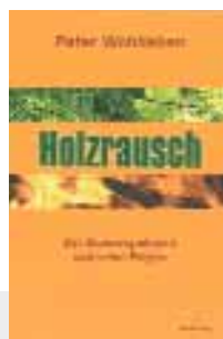
Peter Wohlleben. Adatia Verlag, 160 Seiten, ISBN 978 3 940 461 032, € 14,90

Gegenstand romantischer Kunst und Dichtung, Rückzugs- und Erholungs-ort, aber vor allem Symbol unberührter Natur: Das ist für uns der Wald. Doch was wir für unberührt halten, ist es schon lange nicht mehr. Ein Förster berichtet aus der Praxis: von den Schäden, die Holzindustrie und Jäger anrichten, warum Bioenergie aus Holz falsch verstandener Klimaschutz ist und wie wir das fragile Ökosystem Wald vor dem Kollaps bewahren können. Danach wird man den Wald mit anderen Augen sehen. Der Autor bewirtschaftet einen ökologischen Vorzeigewald in der Eifel und zeigt, wie es anders gehen könnte: Er verzichtet auf Pflanzenschutzmittel und setzt konsequent auf heimische Buche. Eine spannende Lektüre mit vielen Aha-Erlebnissen.