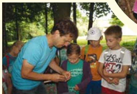
Seit vielen Jahren ist der Tag beim Imker ein Fixpunkt im Jahresprogramm!