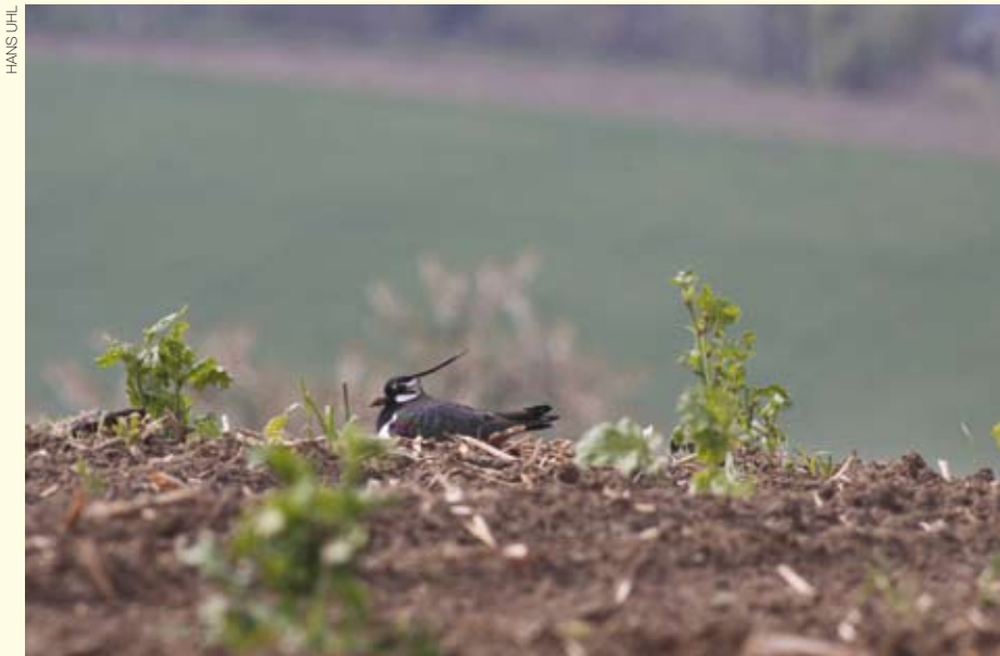
Kiebitz-Männchen brütet erfolgreich, nach Ausstecken und Schonung des Geleges, Perna, 28.4.2016

Ein zweijähriges Artenschutzprojekt untersucht, welche Maßnahmen sich positiv auf die Kiebitzbestände im Naturpark Obst-Hügel-Land auswirken. Die Ergebnisse 2016 waren ermutigend.