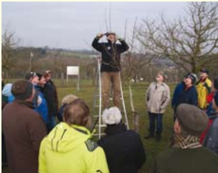
Reges Interesse bei den Baumschnitt- und Veredlungskursen im Naturpark.

Unser Veranstaltungsprogramm begleitete die Besucher das ganze Jahr hindurch: Von der Obstbaumblüte im Frühjahr bis zum Mostmachen im Herbst, vom Bärlauch bis zum Pilze sammeln, vom Obstbaumschnittkurs bis zur Kirschblütenwanderung - so umfangreich und vielfältig konnte man 2016 den Naturpark erleben.