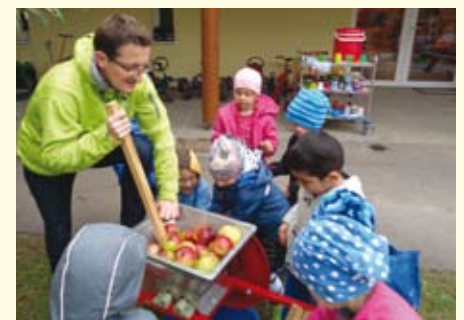
Gemeinsames Obstpressen und Saft verkosten im Herbst