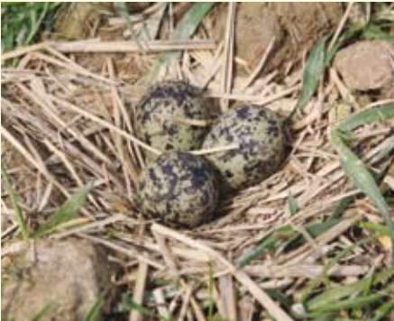
Oben: Vertragsnaturschutzfläche in Eben Unten: Kiebitz-Gelege