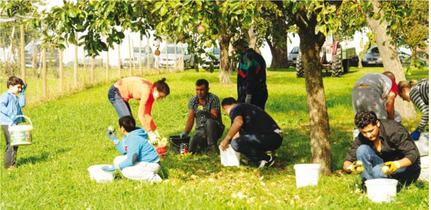
Obstklaubm - nix waviastn! Asylwerber klaben gemeinsam mit freiwilligen Helfern das auf den Streuobstwiesen liegende Obst.

Das Sozialprojekt „Obstklaubm - nix waviastn“ hat sich zum Ziel gesetzt, Streuobst, das auf den Wiesen liegen bleibt und die Zeit von Menschen im Asylwerberheim, die nicht arbeiten dürfen, zusammen zu bringen.