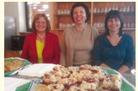
Ein wichtiger Teil der Workshops: das Verkosten von Kirschen- und Apfel-Mehlspeisen ...

Eine Auswahl an neu geplanten Angeboten und Maßnahmen sind in der Übersicht auf der nächsten Seite dargestellt. Bei sämtlichen Vorhaben wurde auch berücksichtigt, welche positiven Effekte diese auf die Biodiversität und die Wertschöpfung im Naturpark Obst-Hügel-Land haben.