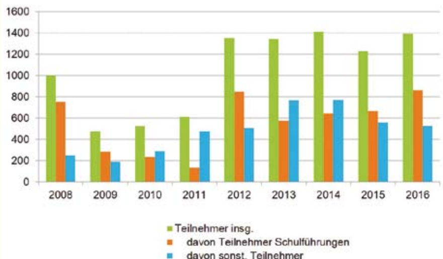
Entwicklung der Teilnehmerzahlen bei Naturparkführungen (2008 bis 2016)