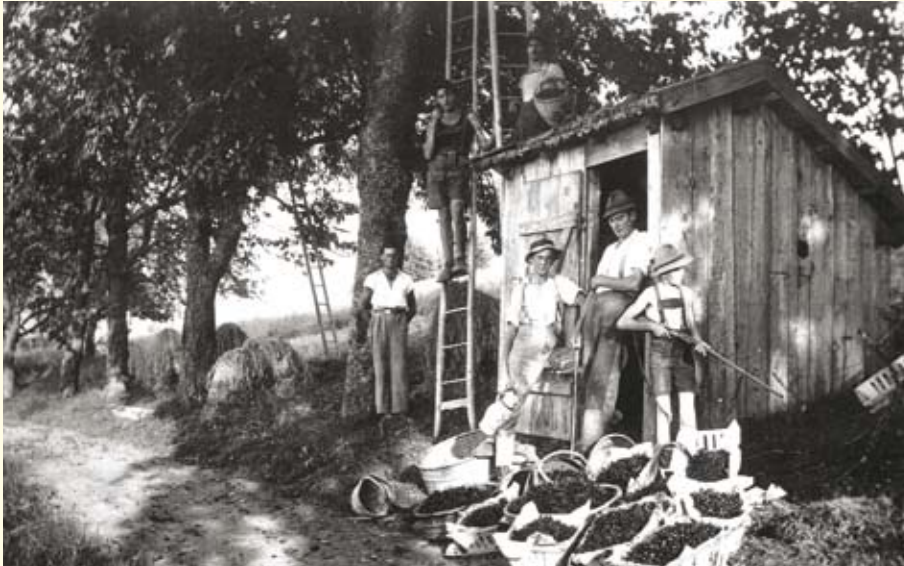
Kirschernte in Scharten (um 1930, Kronbergerhof)

Der Kirschenanbau in Scharten hat eine mehr als 100-jährige Geschichte. Trotz aller Veränderungen wird auch versucht, alte Kirschensorten zu erhalten und wieder ins Bewusstsein zu rücken.