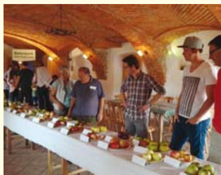
Eine umfangreiche Sortenausstellung kam beim Tag der alten Obstsorten zusammen.