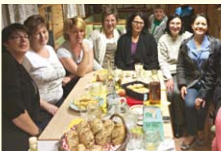
Allerlei Köstlichkeiten aus heimischem Obst und Gemüse gab es bei den Stammtischen für die kreative Küche.