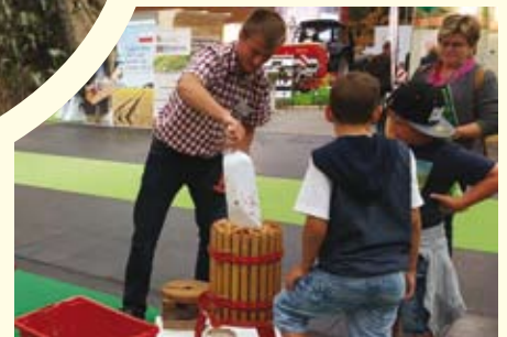
Frisch gepressten Apfelsaft konnten die Besucher beim Naturpark-Stand auf der Welser Herbstmesse genießen.