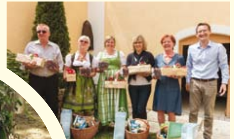
Gewinnspiel bei der Kirschblütenwanderung: Die Freude der Gewinner ist groß!