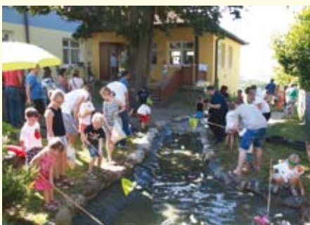
Die beliebteste Station beim Sommerfest war das Spielen am Bach.

Heuer sind im Naturpark-Kindergarten Forscherausflüge in den unterschiedlichen Jahreszeiten vorgesehen. Auf dem Plan steht auch die Errichtung eines kleinen Weidenhauses am Spielplatz des Kindergartens.