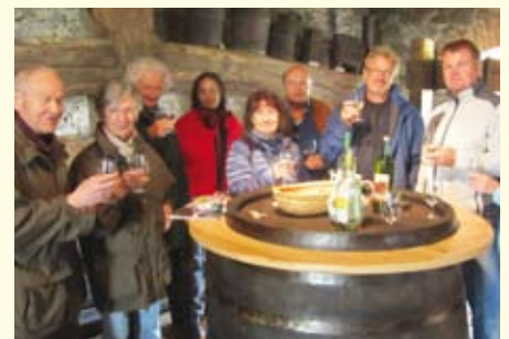
Wo der Bartl den Most holt verbindet Naturführung und Genuss.