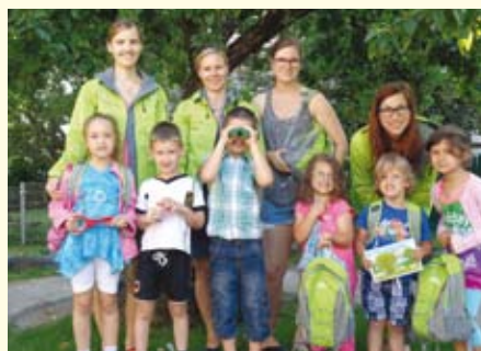
Forscherrucksäcke für die Kinder, Naturpark-Jacken für die Kindergärtnerinnen