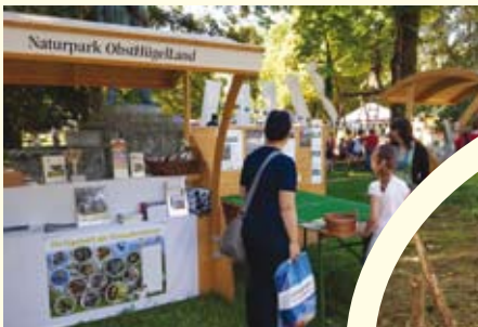
Kirschkern-Zielspucken beim Naturpark-Stand beim Fest der Natur in Linz.