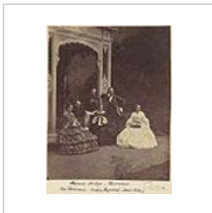
Porträt im Garten