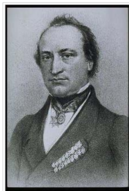
Alois Auer Ritter von Welsbach. Lithographie.

Alois Auer Ritter von Welsbach (* 11. Mai 1813 in Wels, Österreich ob der Enns, als Alois Auer ; † 10. Juli 1869 in Hietzing bei Wien) war ein österreichischer Drucker, Erfinder und botanischer Illustrator. Er war vor allem in den 40er und 50er Jahren des 19. Jahrhunderts aktiv. Er verfasste neben zahlreichen anderen Werken auf deutsch und anderen Sprachen das erste über den Naturselbstdruck. Er war Direktor der österreichischen Staatsdruckerei, die Bildbände von wissenschaftlichem Interesse produzierte.