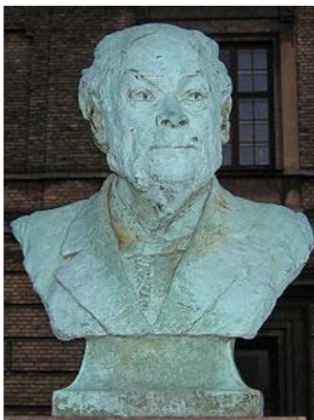
Rudolph Bergh. Buste af P.S. Krøyer

Ludvig Sophus Rudolph Bergh (født 15. oktober 1824 i København, død 20. juni 1909 sammesteds) var en dansk læge og zoolog. Han var far til Rudolph Sophus Bergh.