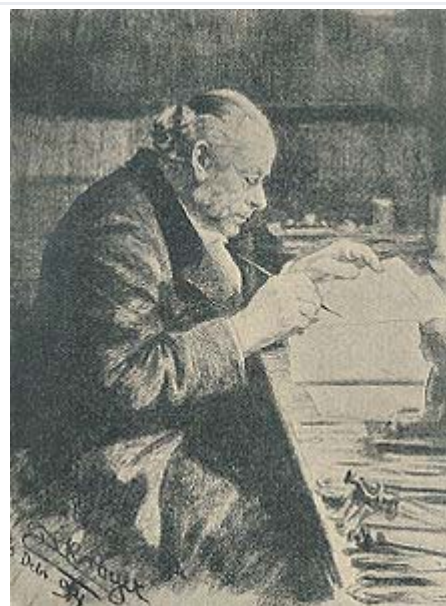
Rudolph Bergh. Tegning af P.S. Krøyer fra 1894