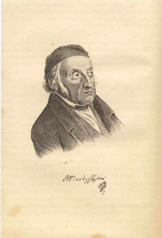
Abbildung 4: Mathias Mielichhofer (aus: STORCH 1857)

Untersberg hat gewiss kein Städter so oft als ich besucht. Oefters gieng ich zur Nachtzeit auf denselben, öfter übernachtete ich auf dessen Höhe.“ (STANIG 1881: 399) Stanig war dabei nicht nur von botanischem Forschungsdrang, sondern auch von sportlichem Ehrgeiz erfüllt, wie sein Hinweis auf die Besteigung des Untersberges in der Nacht und im Winter und seine Berichte über die Besteigung des Watzmann und des Hohen Göll zeigen (STANIG 1881).