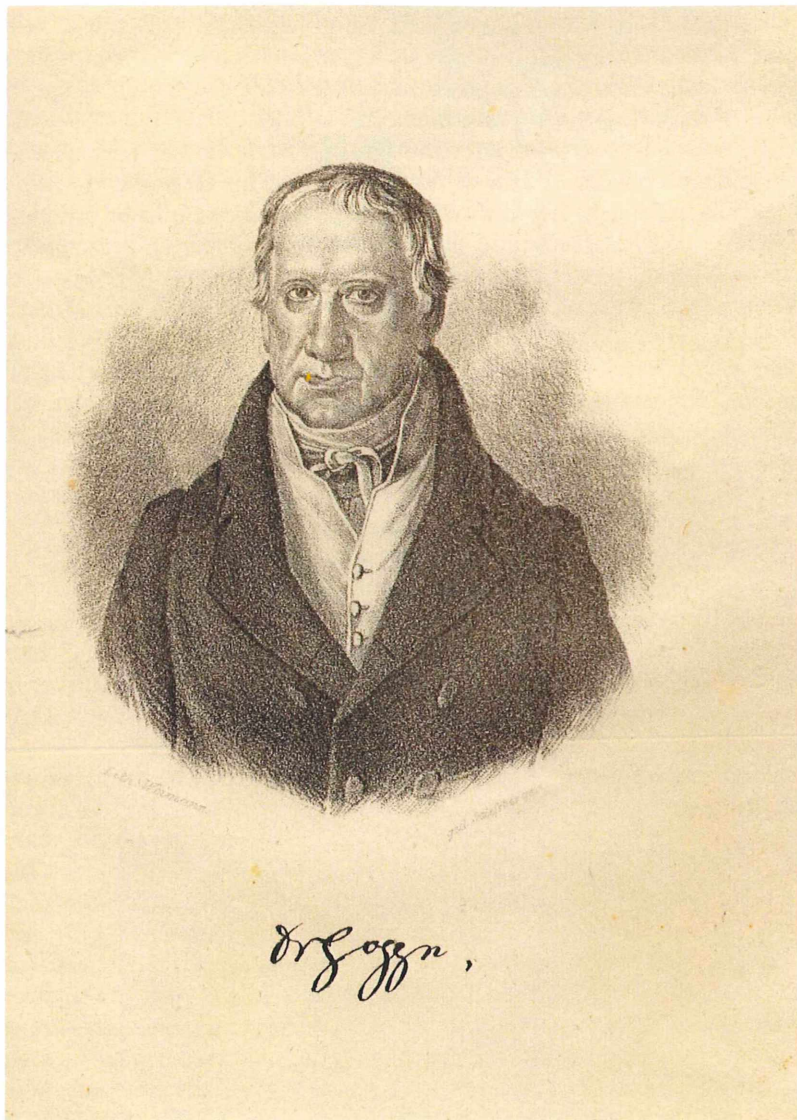
Abbildung 3: David Heinrich Hoppe (aus: STORCH 1857)