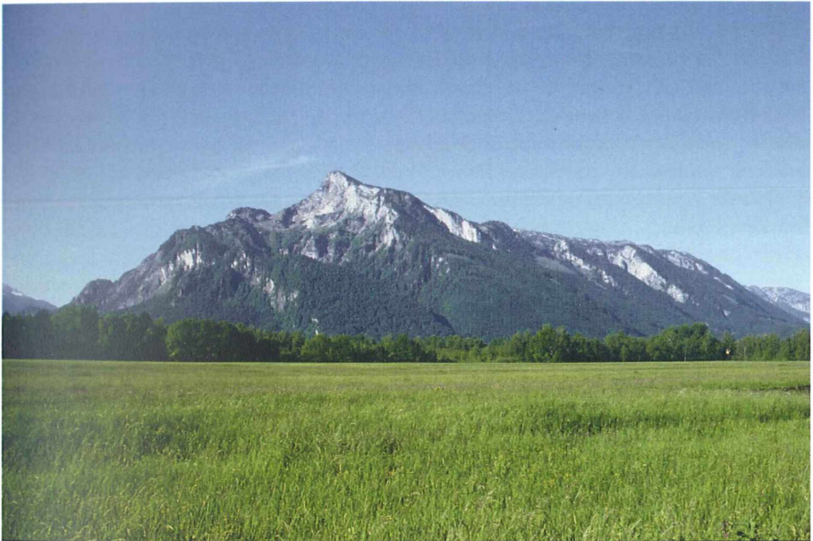
Abbildung 1: Blick von Gneis im Süden Salzburgs auf den Untersberg