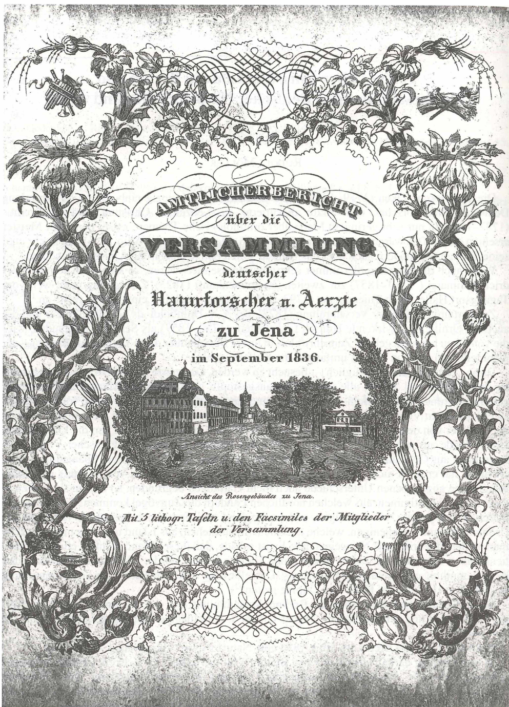
Abb. 1. Umschlagbild zum Bericht über die Jenaer Versammlung Deutscher Naturforscher und Ärzte 1836