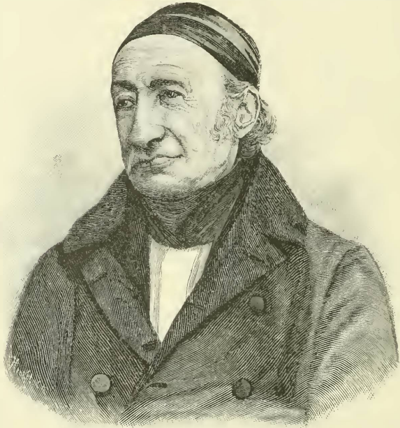
Christian Ludwig Brehm.

Es dürfte den Lesern unserer Monatschrift sicher nicht unwillkommen sein, einige persönliche Aufzeichnungen aus dem Leben des Altmeisters der Ornithologie, des Vaters des ebenso unvergeßlichen Schöpfers des „Tierlebens“, zu erfahren