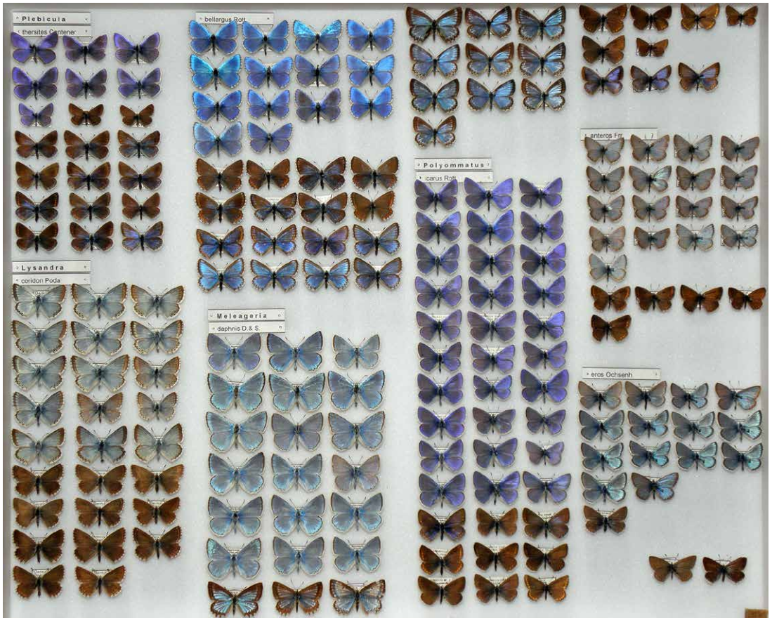
Abb. 4 Kasten Nr. 37 aus der Sammlung E. Friedrich: Bläulinge (Lycaenidae).