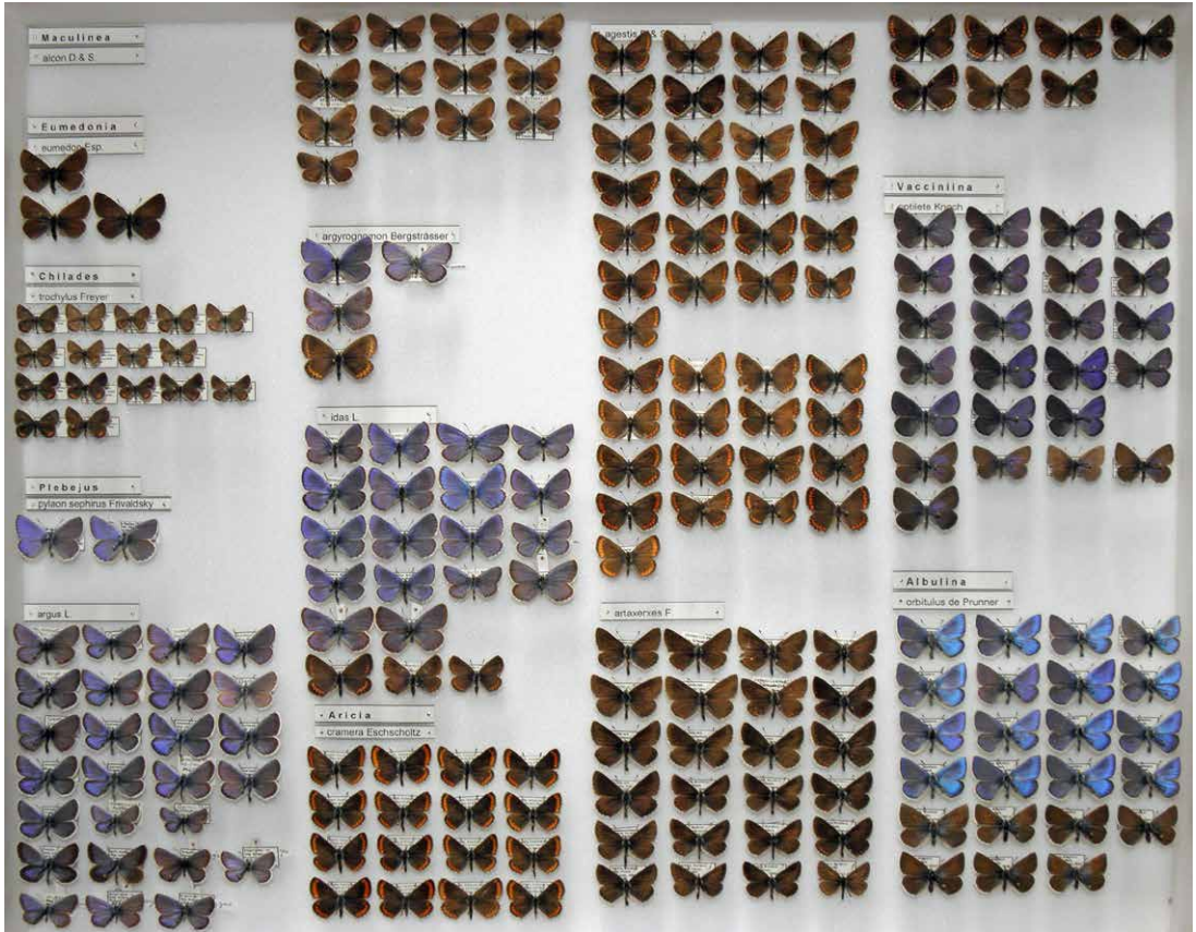
Abb. 3 Kasten Nr. 35 aus der Sammlung E. Friedrich: Bläulinge (Lycaenidae).