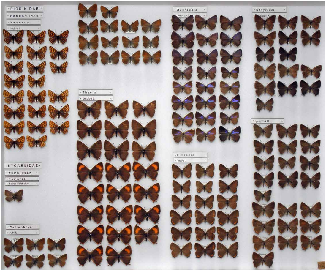
Abb. 1 Kasten Nr. 31 aus der Sammlung E. Friedrich: Bläulinge (Lycaenidae).

Es werden Kürzel für die Bundesländer und Staaten verwendet: