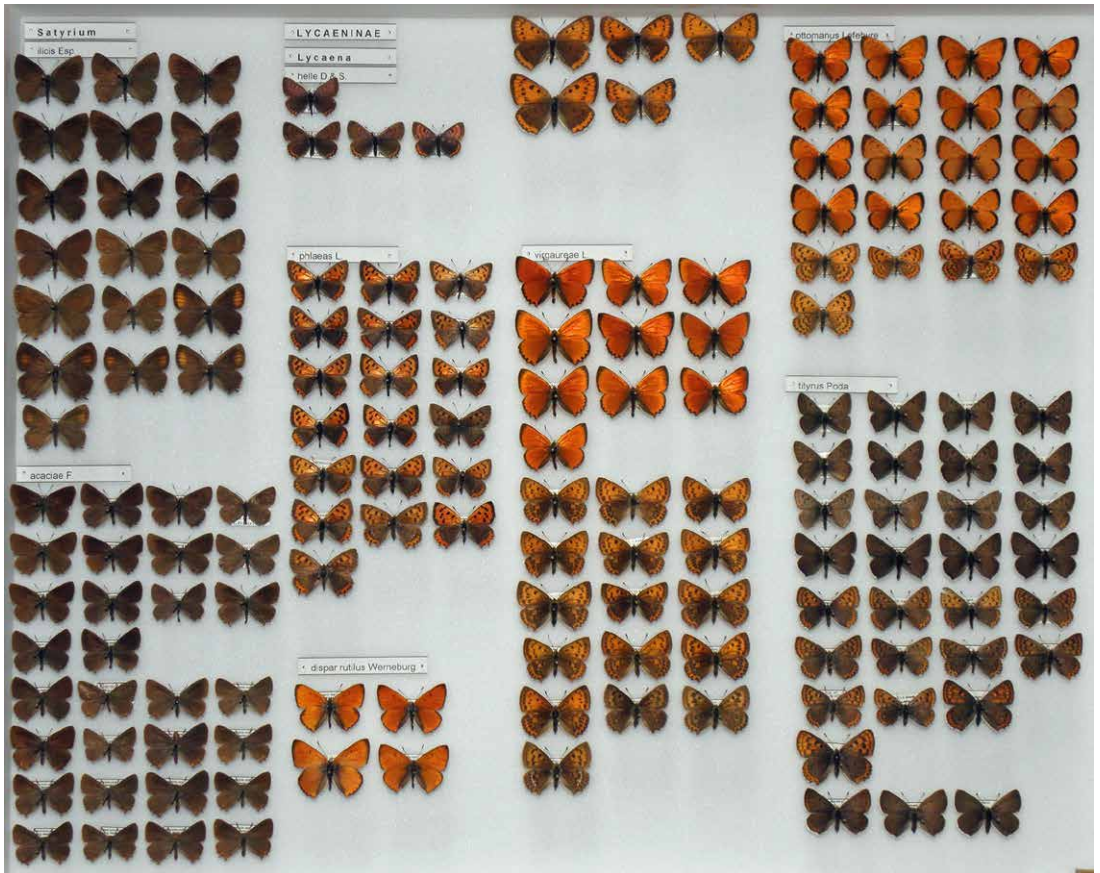
Abb. 2 Kasten Nr. 32 aus der Sammlung E. Friedrich: Bläulinge (Lycaenidae).