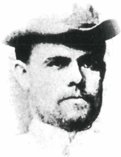
HANS FRUHSTORFER 1866–1922