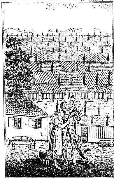
zur Seite 12 Du kleiner Schein! Mach! Wache mit deinen Bäumchen, und bringe so edle Früchte wie sie