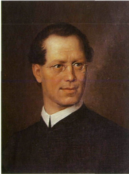
Abb. 1: Meinrad Thaurer von GAlLENSTEIN (1811–1872). Foto nach einem Ölgemälde.

Der Beginn einer ernstzunehmenden zoologischen Forschung in Kärnten ist erst relativ spät – um die Mitte des 19. Jahrhunderts – anzusetzen, im Unterschied zu der seit etwa 1780 im Lande florierenden Botanik und Mineralogie 1 ). Was jedoch die Erforschung der Kärntner Weich-