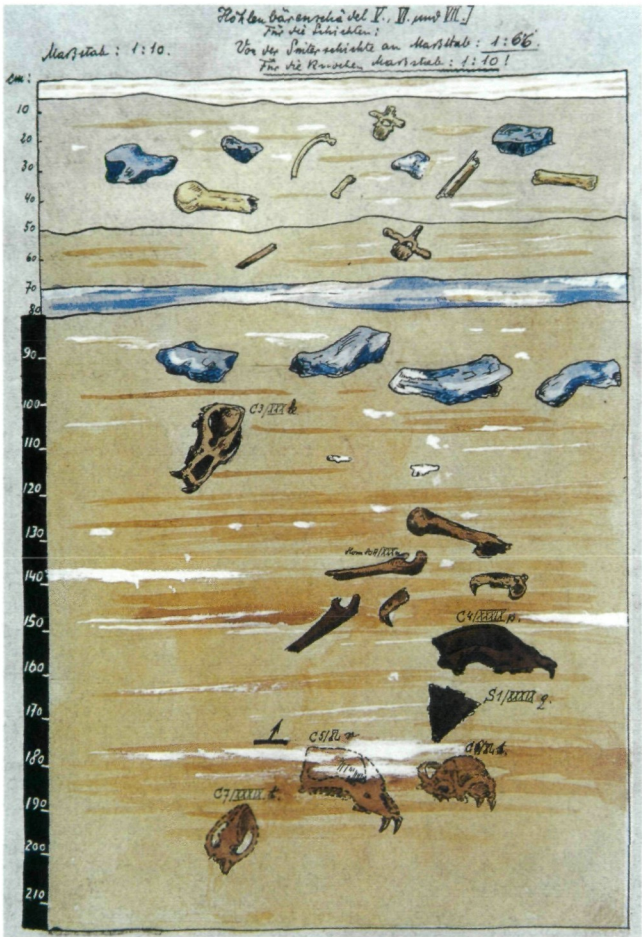
Abb. 6: Ein Grabungsprofil in der Potočnik-Höhle (Grabungsbuch Dr. Groß)

mittellose Patienten kostenlos behandelt und ihnen angeblich teilweise sogar die notwendigen Medikamente geschenkt haben, was ihn selbst in finanzielle Bedrängnis brachte. Über diese selbstlose Hilfe für zahlreiche Kranke wurde noch viele Jahre später im ganzen Tal mit Dankbarkeit gesprochen.