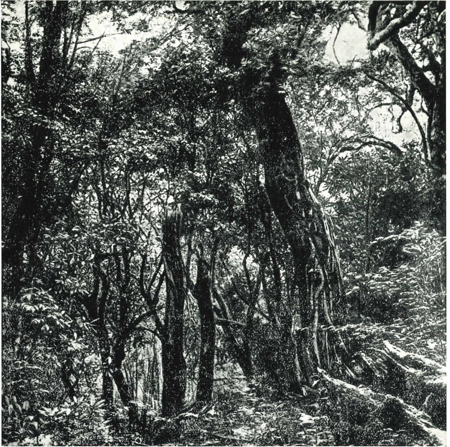
Temperierter Wald im nordostbirmanischen Hochgebirgsgebiet (3425 m) Forests in the Temperate Zone of the High Mountains of Northeast Burma (3425 m) Forêt tempérée sur les massifs élevés en Birmanie du Nord-Est (3425 m)