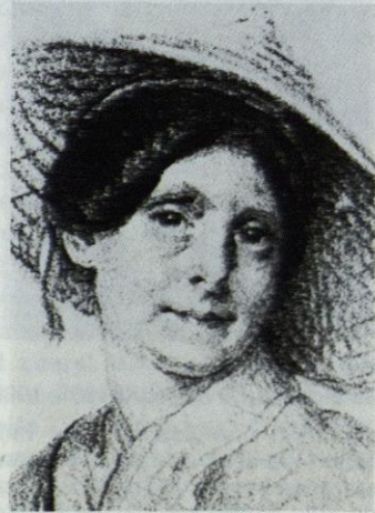
Ida PFEIFFER 1797–1858

Industrieller, der zunächst als Großwildjäger dem Museum selbst erlegte Rekordtrophäen aus den USA, Kanada und Alaska überließ, dabei fachliches Interesse an der Säugetierforschung gewann und zur Ausgestaltung der Säugetiersammlung des Museums einen namhaften Betrag stiftete, aus dem nicht nur zahlreiche Ankäufe bei den bedeutendsten europäischen Naturalienhändlern und Präparatoren getätigt, sondern auch die große Zentralafrika-Expedition Rudolf GRAUERS finanziert werden konnten. Der begeisterte Afrikareisende wurde 1911 in der Nähe von Mongalla/Sudan von einem verwundeten Büffel getötet.