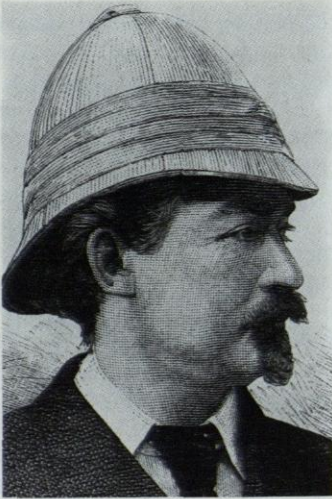
Emil HOLUB 1847–1902

Durchzog, nachdem er sich als Arzt in der Diamantenstadt Kimberley die Mittel für diese Expeditionen verdient hatte, 1875–1879 auf mehreren Reisen damals noch völlig unerschlossene Gebiete von Transvaal, Botswana und Rhodesien und erreichte auf einer weiteren großen und zoologisch ergiebigen Expedition 1883–1887 unter enormen Strapazen und Gefahren als erster Europäer das Barotseland/Sambia.