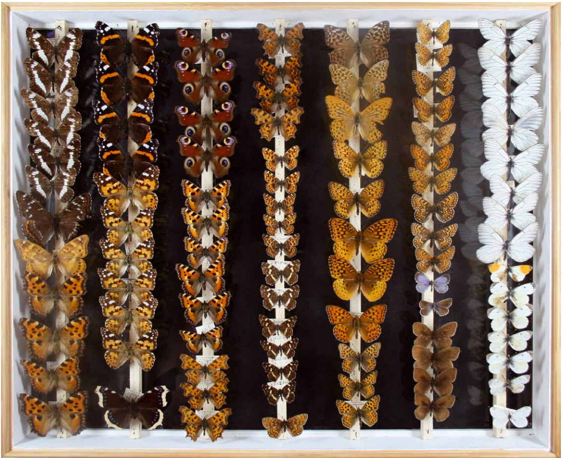
Abb. 2 Sammlung Hullmann, Inv. Nr. I-0022-C, Foto: Jahne Harmeling, 2012.