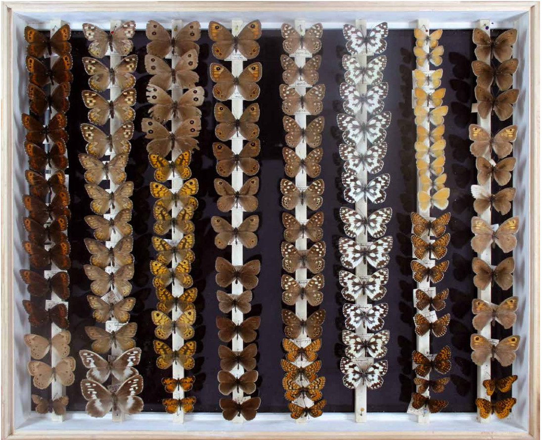
Abb. 1 Sammlung Hullmann, Inv. Nr. I-0021-C, Foto: Jahne Harmeling, 2012.

Für eine faunistische Auswertung verbleiben 242 Datensätze. In den folgenden Tabellen erfolgt die Auflistung in alphabetischer Reihenfolge der verwendeten Gattungsnamen; Nomenklatur nach REINHARDT et al. (2007).