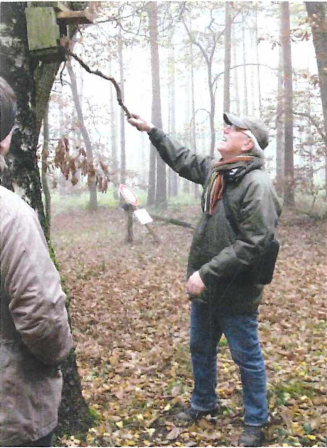
Abb. 2: Nistkastenkontrolle Schmiedewald Gut Adolphshof, 10.11.2006