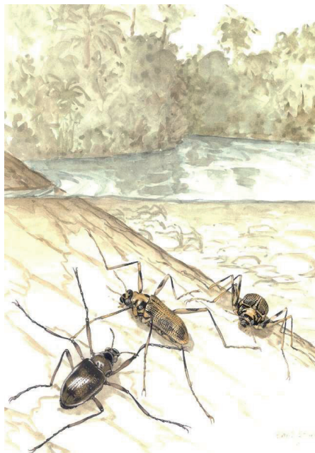
Ancyronyx acaroides (ganz links) und A. malickyi (zwei Exemplare rechts) auf untergetauchtem Holz.