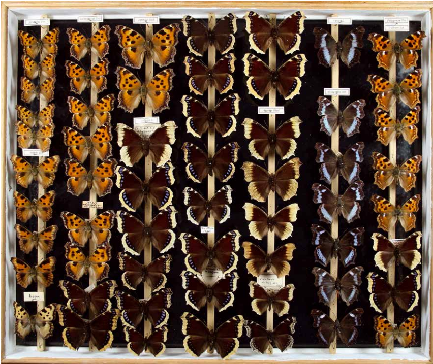
Abb. 3 Edelfalter – Nymphalidae Inv.-Nr. I-239-C