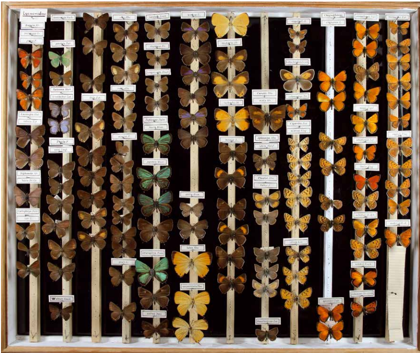
Abb. 4 Bläulinge – Lycaenidae Inv.-Nr. I-246-C