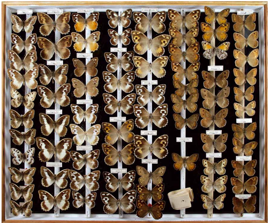
Abb. 2 Augenfalter – Satyrinae Inv.-Nr. I-230-C