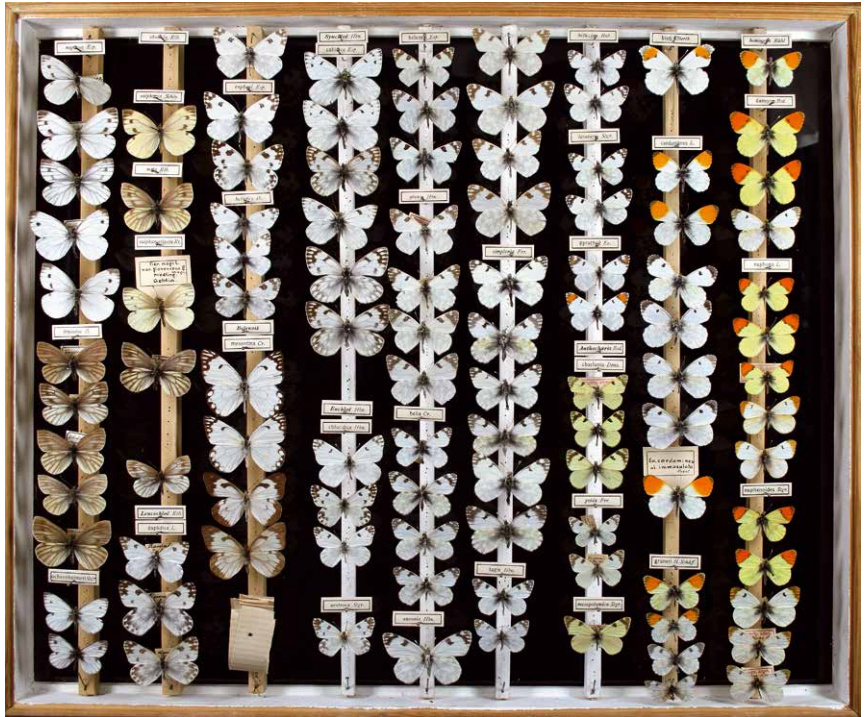
Abb. 1 Weißlinge – Pieridae Inv.-Nr. I-222-C