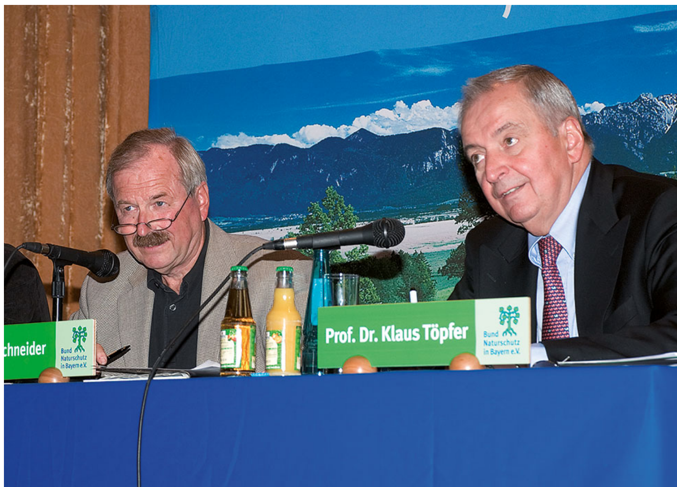
Mit Klaus Töpfer beim Bund Naturschutz-Forum im Münchner Lenbachhaus