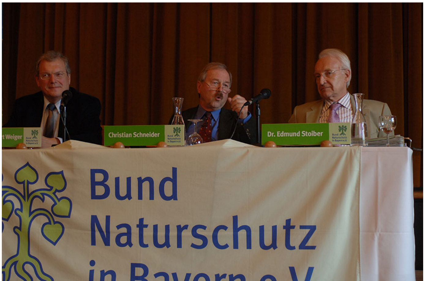
Mit dem damaligen bayerischen Ministerpräsidenten Edmund Stoiber beim Bund Naturschutz-Forum