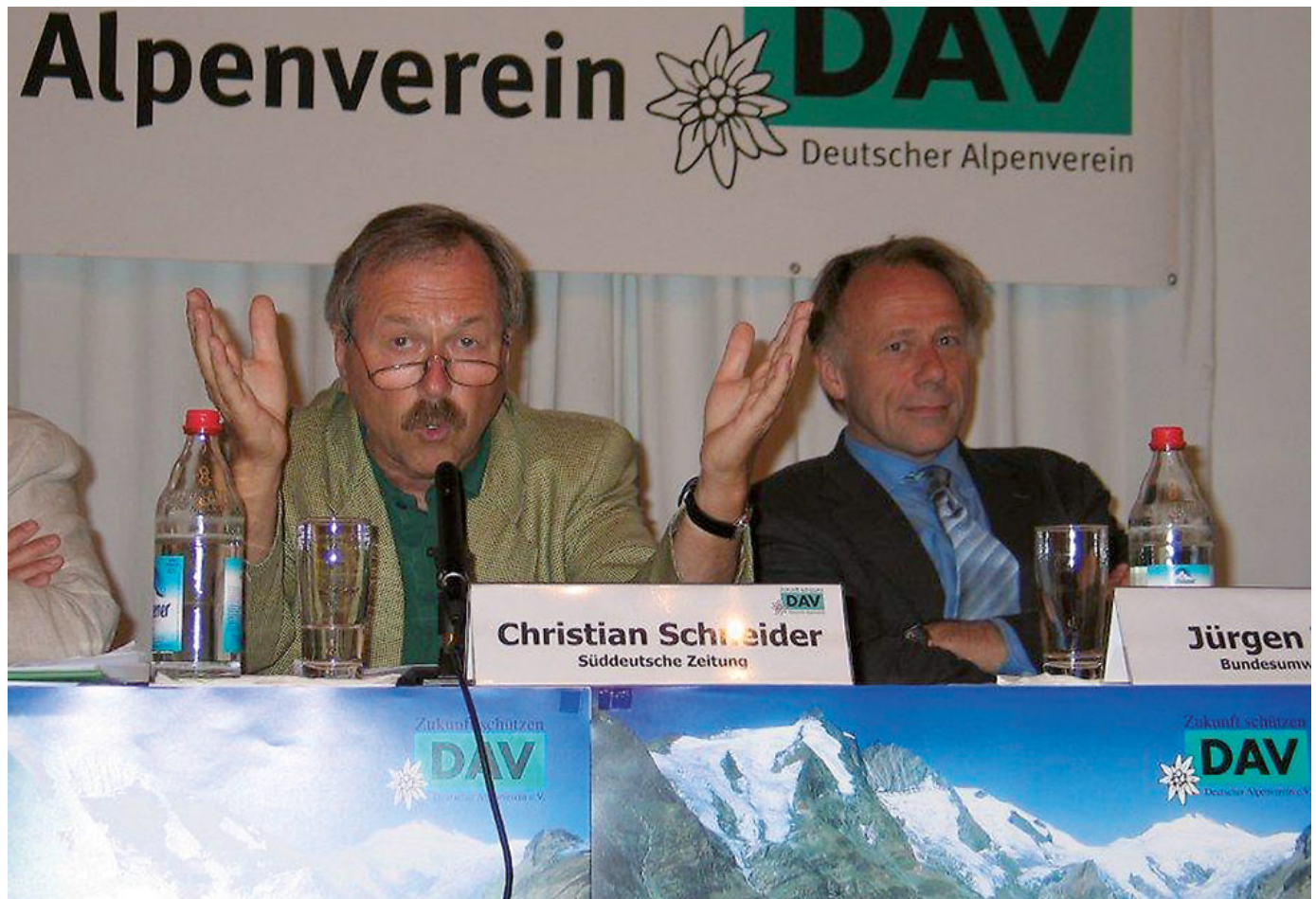
Mit Bundesumweltminister Jürgen Trittin beim Bergforum auf der Praterinsel in München

Heute bedauert er, dass die Zeit für die dazu notwendigen Recherchen in vielen Redaktionen aufgrund von Kostenzwängen fehlt und manche Redaktion anfälliger wird gegenüber Einflussnahmen von außen.