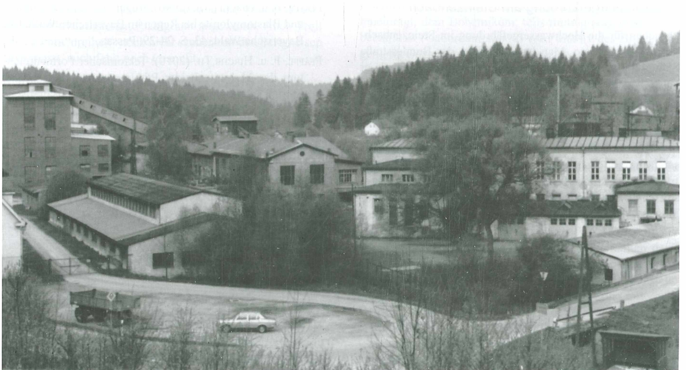
Das Graphitwerk Kropfmühl mitte der 1960er Jahre