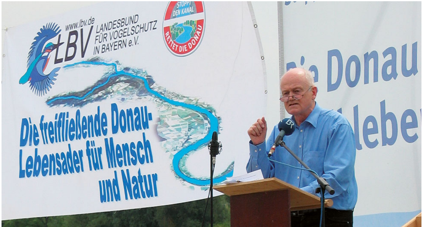
Beim alljährlichen Donaufest in Niederalteich