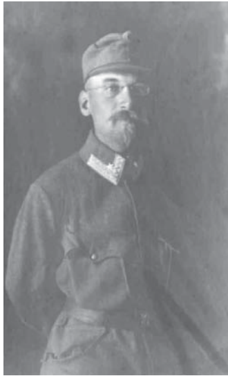
Abb. 2: Albrecht Spitz. Aufnahme Sommer 1918

Weise konnte wenigstens ein Teil der reichen wissenschaftlichen Ernte von SPITZ gerettet werden. Posthum erschienen noch acht Arbeiten von ihm.