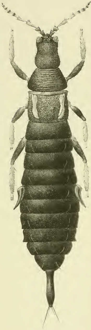
Phlecothrips lativentris Heeger.