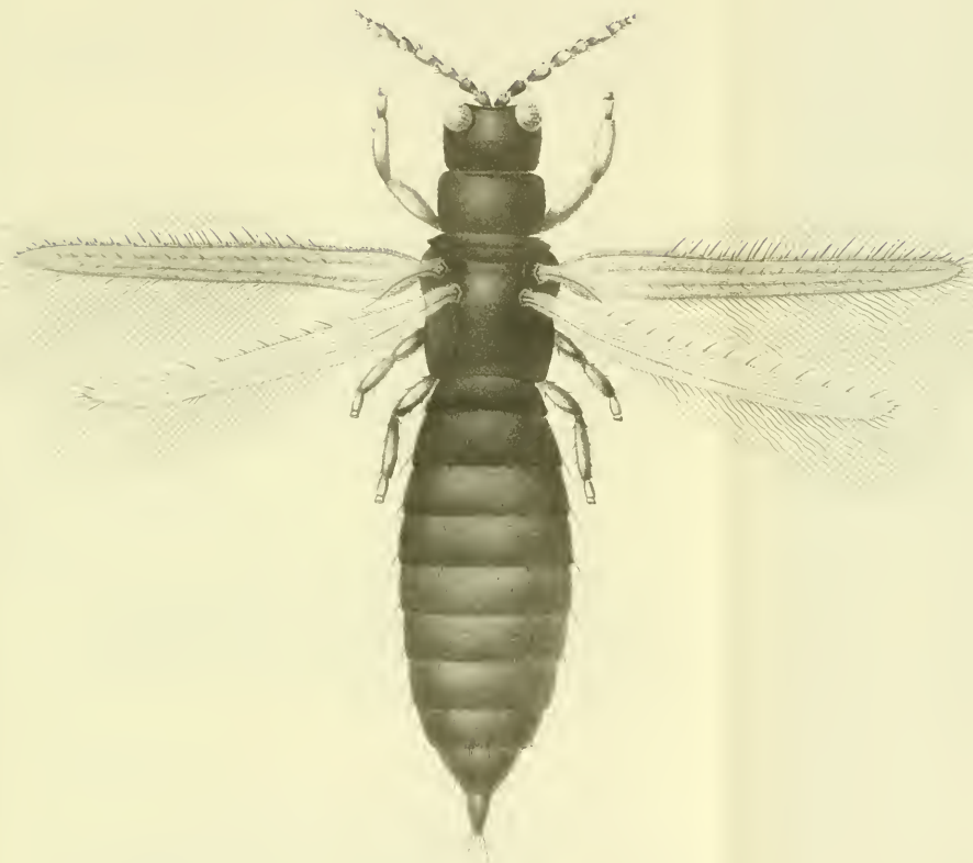
Thrips vulgarissima Haliday.