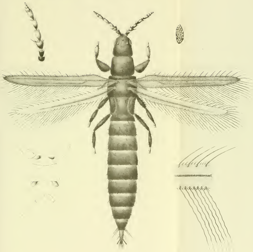
Thrips kollari Heeger.