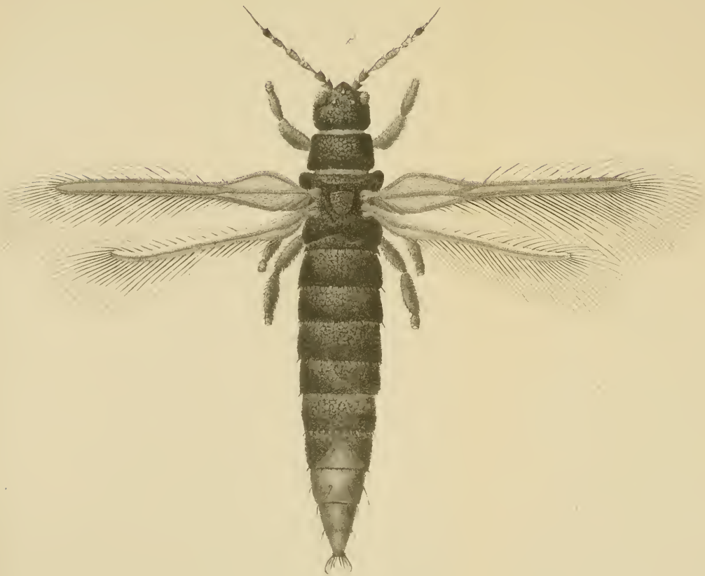
Heliothrips haemorrhoidalis Bouche.