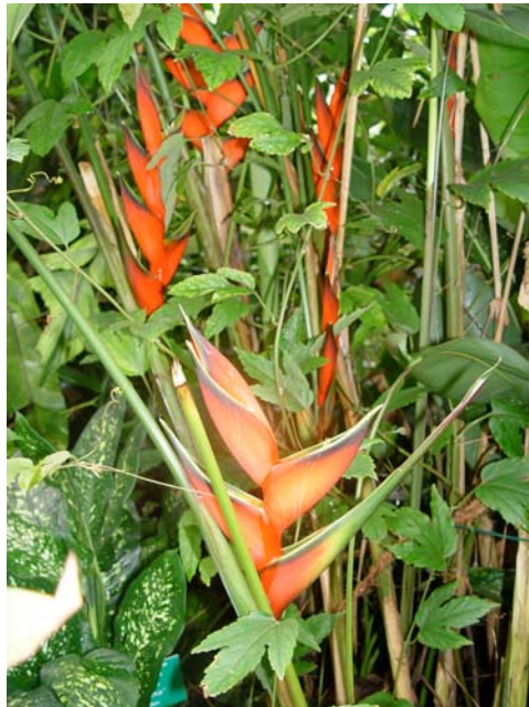
Heliconia lathispata im Tropenhaus, ein auffallender Vertreter aus der Familie der Bananengewächse

Auch wenn der Sommer in seiner Vielfalt die Freilandanlagen prägen, sind auch die Gewächshäuser immer einen Besuch wert. Überall ranken im Tropenhaus und im Eingangshaus die Passionsblumen ( Passiflora ), wie z.B. Passiflora vitifolia mit schönen knallroten Blüten. Auch die Pfeifenwinde ( Aristolochia grandiflora ) zeigt ihre großen bräunlichen Kesselfallenblüten. Sie gehört zu der Familie der Osterluzeigewächse und stammt aus Mittel – und Südamerika. Sie windet sich über dem Victoriabecken in den First des Tropenhauses. Ein besonderer Blickfang ist die Heliconia lathispata im Mittelbeet des Tropenhauses mit ihrem auffallenden roten Blütenstand. Die mit etwa 150 Arten im tropischen Amerika verbreitete Gattung Heliconia ist Mitglied der Familie der Bananengewächse ( Musaceae ).