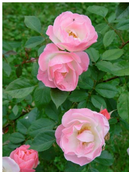
Eine von vielen alten Rosensorten: die Strauchrose „Erfurt“

Bereits im Eingangsbereich fallen die bunten blühenden Strauchrosen ins Auge. Diese sind aber nur ein Vorgeschmack auf die üppige Rosenblüte , die sich im Rosarium bietet. Bei einem Spaziergang durch diese Anlage kann man sich nicht satt sehen an der Vielfalt der Farben und Formen: Zentifolienrosen, Kletterrosen, Teerosen, Polyanthosen,