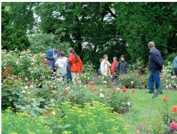
Viele Gäste erfreuen sich an den Rosen im Rosarium

Im Botanischen Garten ist zur Zeit alles auf Rosen eingestellt. Es ist Hauptblütezeit für diese älteste Zierpflanze der Welt, die schon seit 3000 Jahre gezüchtet wird. Nicht umsonst wird sie als „Königin der Blumen“ bezeichnet. Die ersten gesicherten Berichte reichen ca. 5000 Jahre zurück: vom Sumererkönig Sargon I (2600 v.Chr.) wird berichtet, dass er Weinstöcke, Feigen und Rosenbäume in sein Reich brachte.