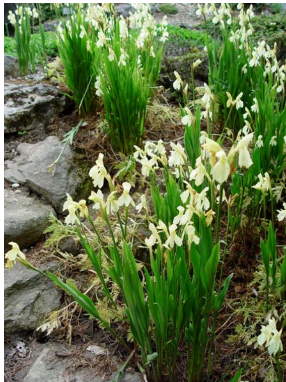
Die Ingwerorchidee im Alpengarten – schaut einer Orchidee ähnlich, gehört jedoch zur Familie der Ingwergewächse

Auch in den übrigen Teilen des Gartens gibt es viel zu sehen: Im Alpinum blüht die Ingwerorchidee ( Roscoea cauleioides ), die eigentlich keine Orchidee ist, sondern zu den Ingwergewächsen gehört und in China wild lebend vorkommt. Im Alpengarten blüht auch der Almrausch ( Rhododendron intermedium ) und die Breitblättrige Glockenblume ( Campanula latifolia ). Die Japanorchidee ( Bletilla striata ) bildet ein lilablühendes Beet im Systemgarten. Entlang des Hauptweges steht der aus Ostasien stammende Indigostrauch ( Indigofera ) in Blüte. In den großen Teichanlagen beim Veranstaltungspavillon öffnen bei Schönwetter täglich die Seerosen ihre Blüten, darunter auch die wiederentdeckte weiße Sorte „Pöstlingberg“.