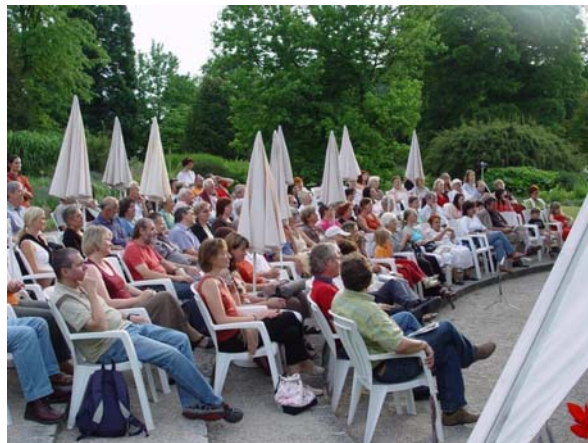
Danke für den großartigen Besuch!

Nur mehr wenige Tage trennen uns von den Weihnachts- und Silvesterfeierlichkeiten - auch für uns Anlass zur Besinnung und Rückschau. Es war ein sehr schönes Gartenjahr mit vielen Höhepunkten und Erfolgen. Zuerst einen großen Dank an Sie als unsere Gäste: Sie haben uns mit Ihrem regelmäßigen Besuch eine Steigerung der Gästezahlen von 20 000 gegenüber 2006 beschert (insgesamt ca. 95 000 Gäste). Auch das Angebot an Ausstellungen und Kulturveranstaltungen verlief äußerst erfolgreich: Mehr als 1.600 Interessierte konnten wir bei den Wort & Klang-Veranstaltungen begrüßen. Die Bibelpflanzen- und Dahlienausstellung lockte im Sommer rd. 36 000 bzw. 20 000 BesucherInnen an. Auf zunehmendes Interesse stoßen auch die Kinderangebote: Sämtliche angebotenen Workshops waren ausgebucht. Der am besten besuchte Monat war heuer – wetterbedingt – der April mit fast 15 000 Gästen. Was uns aber am meisten freut sind die tollen Rückmeldungen über unseren Garten: regelmäßig ernten wir großes Lob über die Schönheit und Gepflegtheit des Botanischen Gartens. Das soll Ansporn für uns sein, diese Qualität zu wahren bzw. ständig zu verbessern.