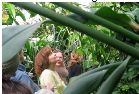
Lassen Sie sich begeistern von unseren Schmetterlingen im Tropenhaus

Bitte beachten Sie, dass wir am 24., 25. und 31. Dezember sowie am 1. Jänner geschlossen haben. Sonst steht einem Besuch nichts im Wege.