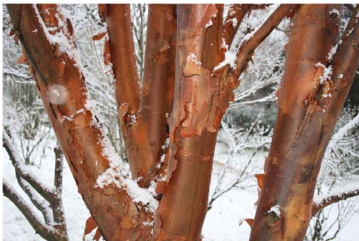
Zimt-Ahorn ( Acer griseum )

Wahrscheinlich geht es Ihnen genauso: Von der angeblich „stillsten“ Zeit im Jahr ist im hektischen Gewühl der Einkaufsstraßen, den punsch- und glühweinseligen Weihnachtsfeiern und bratwurst- und krapfenduftenden Adventmärkten nicht viel zu bemerken. Wenn Sie ein wenig zur Ruhe und Besinnung kommen wollen, bietet sich der Botanische Garten als ideale Oase der vorweihnachtlichen Einkehr an. Der Neuschnee hat das Freigelände zu einem fast kitschig anmutenden „Winter Wonderland“ gemacht – ideal für entspannende Spaziergänge und interessante Naturbeobachtungen. Der Großteil der Pflanzen macht zwar Pause, aber es gibt auch Ausnahmen: eigenartigerweise hat jetzt der Duftsneeball ( Viburnum x bodnantense ) seine zart-rosafarbenen Blüten angesetzt. Die leuchtend roten Früchte der Stechpalme ( Ilex ) bieten spannende Farbkontraste im Schnee. Da und dort lässt sich noch eine verwelkende Rose entdecken und die Rindenstrukturen der Japan-Birke ( Betula maximowicziana ) oder des Zimt-Ahorns ( Acer griseum ) zeigen erst jetzt ihre Anmut und Schönheit.