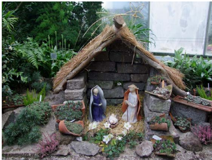
Blumenkrippe mit Sempervivum im Eingangshaus

Gleich im Eingangshaus werden Sie von unserer Blumenkrippe empfangen. Die vom Keramikatelier „Mont Martre“ im Jahr 2006 künstlerisch gestalteten Krippenfiguren werden jedes Jahr in ein neues botanisches Thema gestellt. Heuer steht die Gattung „Sempervivum“ im Mittelpunkt. Die als „Haus- oder Dachwurz“ bekannten Rosettenpflanzen besitzen sukkulente Blätter und besiedeln sehr trockene, nährstoffarme, lebensfeindliche Standorte auf Felsen oder Dächern und können als Symbole des „immerwährenden Lebens“ gelten. So heißt nämlich wörtlich übersetzt der wissenschaftliche Name dieser Pflanzengruppe. Es sind ca. 30 verschiedene Wildarten beschrieben. Mehrere 1000 Züchtungen sind in gärtnerischer Verwendung. Die Sempervivum-Krippe soll ein kleiner Vorgeschmack auf eine Sonderschau im nächsten Jahr sein.