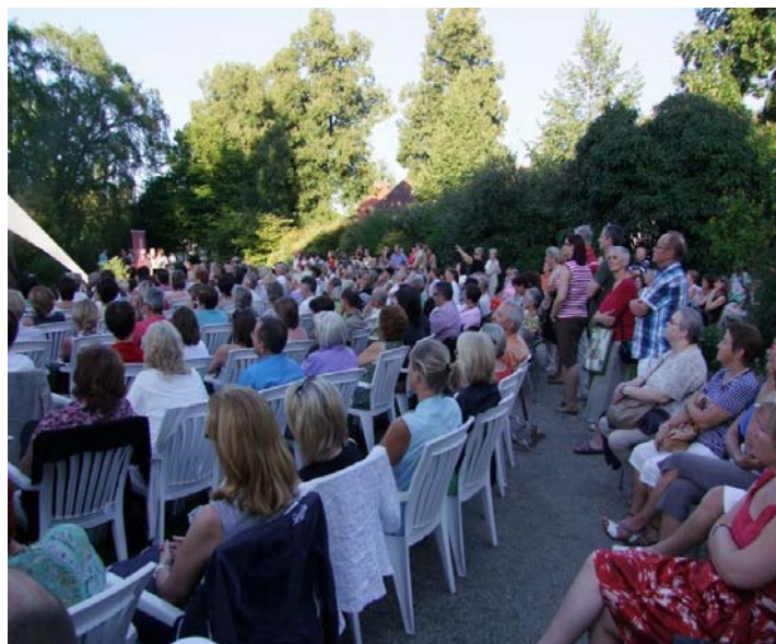
Wort & Klang-Konzert

Auch das Veranstaltungsprogramm wurde von unseren Gästen sehr gut angenommen. Mehr als 2250 BesucherInnen konnten wir bei den diversen Einzelveranstaltungen (Vorträge, Workshops, Spezialführungen, Gartenpraxis, Kreativangebote, Kinderangeboten und Konzerte) begrüßen. Die sommerliche Konzertreihe „ Wort & Klang “ genießt immer bessere Popularität. Obwohl das Wetter nicht immer mitspielte, haben rund 1500 Gäste die außergewöhnliche Atmosphäre auf der Gartenbühne genossen. Den Rekord stellten French Connection am 1. August auf: über 500 Menschen drängten sich im Bereich der Bühne.