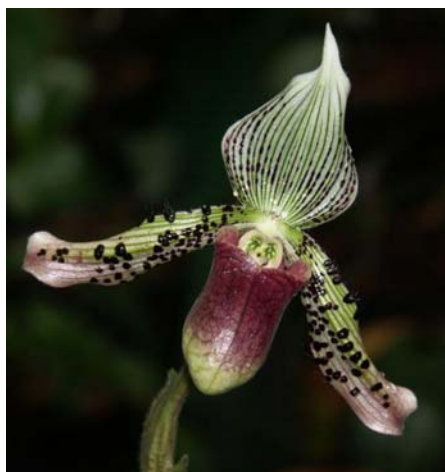
Im Februar und März steht der Botanische Garten ganz im Zeichen der Orchideen

Für uns hat ein neues Veranstaltungsjahr begonnen und wir haben uns wieder viel vorgenommen: Im soeben präsentierten Jahresprogrammfolder finden Sie 108 verschiedene Veranstaltungen. Der Reigen spannt sich von Natur- und Kunstaustellungen, Kreatives & Entspannung, Gartenpraxis über Verkaufs- und Beratungstage, Kinderangebote, Vorträge und Spezialführungen bis zur beliebten Konzertreihe „Wort & Klang“ in den Sommermonaten.