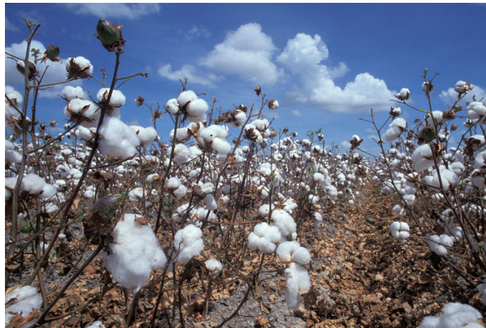
Schwerpunktausstellung im Sommer: Geschichte und Alltag der Baumwolle