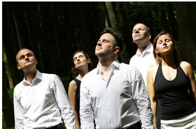
Improvisationstheater mit den ZEBRAS am 25. Juni