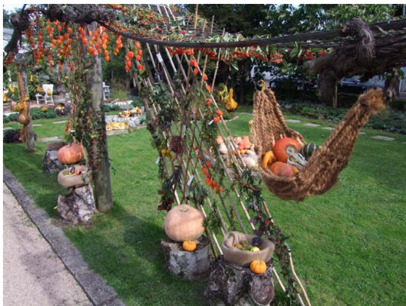
Herbstlicher Fruchtschmuck im Eingangsbereich

Bevor die Vegetation eine Pause einlegt und sich zur Winterruhe begibt, wartet sie im Herbst noch einmal mit einem überschwänglichen Farben- und Blütenrausch auf, der sich durchaus mit dem Sommer messen kann. Der Botanische Garten lädt Sie ein, an diesem prächtigen Schauspiel teilzuhaben: Vom 20. September bis 26. Oktober können Sie im Rahmen der traditionellen Herbstblumenschau noch einmal in Farben schwelgen. Das bunte Laub der Bäume leuchtet an sonnigen Tagen um die Wette mit vielfältigen Herbstblühern und schmückenden Blättern und Gräsern. Für bunte Blütenpracht sorgen die Chrysanthemen , die mit ca. 15 verschiedenen Sorten vertreten sind.