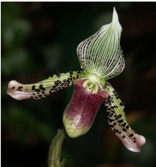
Asiatischer Frauenschuh Paphiopedilum argus

Derzeit haben eindeutig die Orchideen Hochsaison. Die Ausstellung „ Zauberwelt der Orchideen – märchenhaft und mystisch “ hat noch bis Sonntag, 11. März geöffnet. Der Botanische Garten Linz besitzt ja eine überaus artenreiche Sammlung mit ca. 1.100 verschiedenen Arten und Sorten. Ein besonderer Schwerpunkt liegt bei den Wildarten von Frauenschuhorchideen.