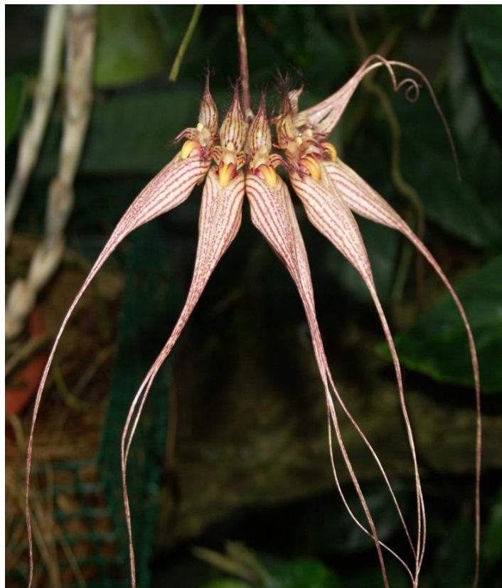
Eine besonders bizarr geformte Orchidee namens Cirrhopetalum rothschildianum

Mit diesen beiden stellvertretend stehenden Gruppen soll gleichzeitig die überwältigende Formen- und Farbenvielfalt der Orchideen verdeutlicht werden. Von winzig klein bis riesengroß, von einfach geformt bis fast außerirdisch bizarr, von einfarbig schlicht bis unglaublich bunt, fasziniert die Blütenvielfalt dieser Pflanzenfamilie, die mit ca. 35.000 wild vorkommenden Arten zur artenreichsten der Welt gehört. Vermutlich gibt es noch einmal so viele, die bislang noch unentdeckt und unerforscht geblieben sind! Bereichert wird diese unüberschaubare Vielfalt von mehr als 80.000 Züchtungen und Hybriden, die weltweit als Zierpflanzen kultiviert werden.