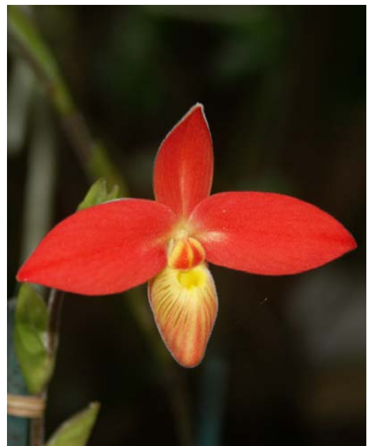
Südamerikanischer roter Frauenschuh