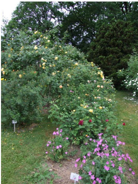
Der Rosengarten erlebt seine erste Blühwelle

Dem Genuss sollte nichts im Wege stehen. Das Einzige, was Sie tun müssen: den Botanischen Garten besuchen, was ich Ihnen mit diesem Newsletter ans Herz legen möchte! Was erwartet Sie? Die Staudenbeete im Senkgarten sind voll mit blühenden Polsterpflanzen. Gleich daneben wartet der Alpengarten mit einer Vielzahl prächtiger Bergpflanzen aus der ganzen Welt auf. Mit über 1.000 verschiedenen Wildarten zählt das Alpinum zu den artenreichsten Alpengarten-Anlagen Österreichs. Am Weg in das Innere des Gartens springen die prächtigen Stauden-Pfingstrosen ins Auge, die heuer pünktlich zu Pfingsten voll in Blüte stehen. Etwas kleiner, aber nicht minder prachtvoll leuchten unterschiedliche Nelkenarten, darunter die Pfingst-Nelken ( Dianthus gratianopolitanus ) und Sonnenröschen ( Helianthemum ) aus den Beeten hervor, die im spannenden Kontrast mit tiefblauen Rittersporen ( Delphinium ) und Geranien stehen.