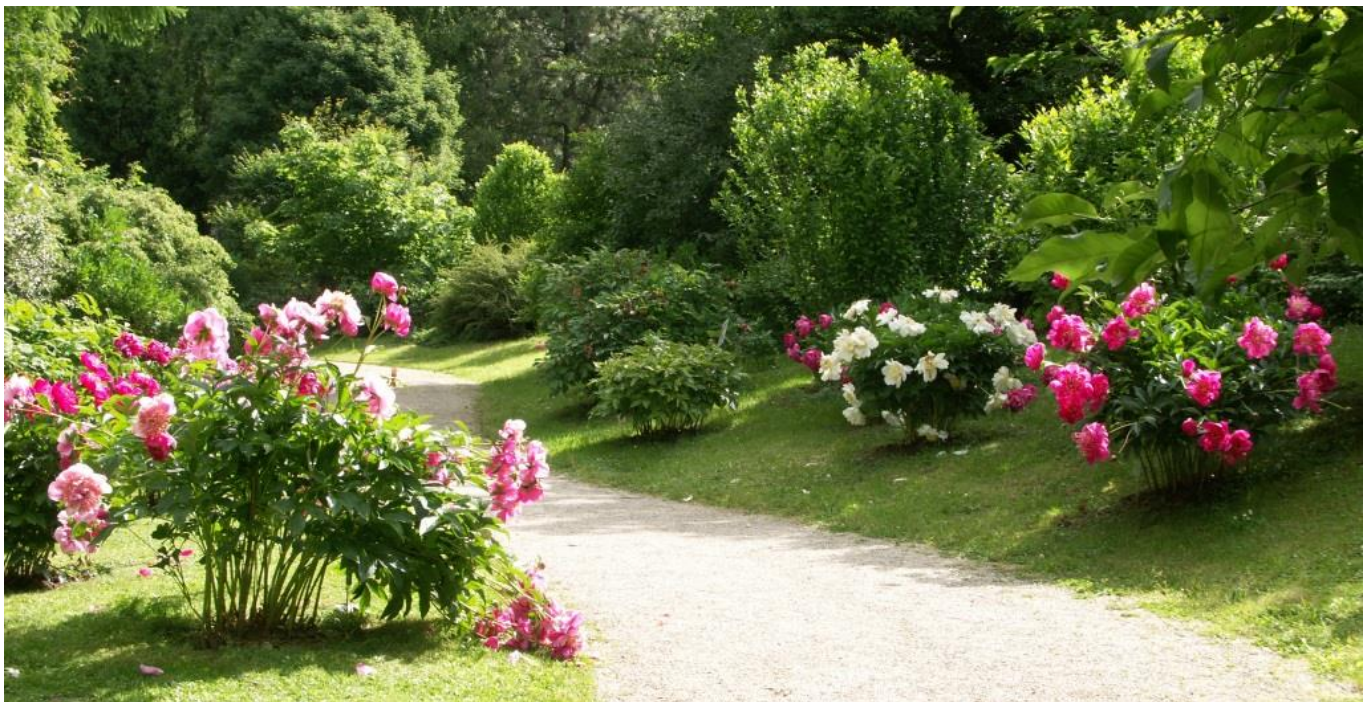
Am Pfingstrosenweg blühen die Stauden-Päonien

Im Nu ist der Frühling verfliegen, denn laut Kalender beginnt Anfang Juni der meteorologische Sommer. Wobei: heuer hat er eigentlich schon in der ersten Maihälfte begonnen. Man spricht nämlich vom phänologischen Sommerbeginn – genauer gesagt vom Frühsommer – wenn die Blütezeit des Holunders ( Sambucus nigra ) einsetzt, und das war im Linzer Raum bereits Anfang Mai der Fall.