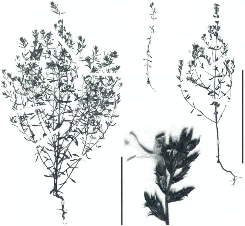
Abb. 4: Variationsbreite von E. salisburgensis var. stiriaca (Steiermark, Vitek E209a). Balken = 10 cm bzw. 1 cm.