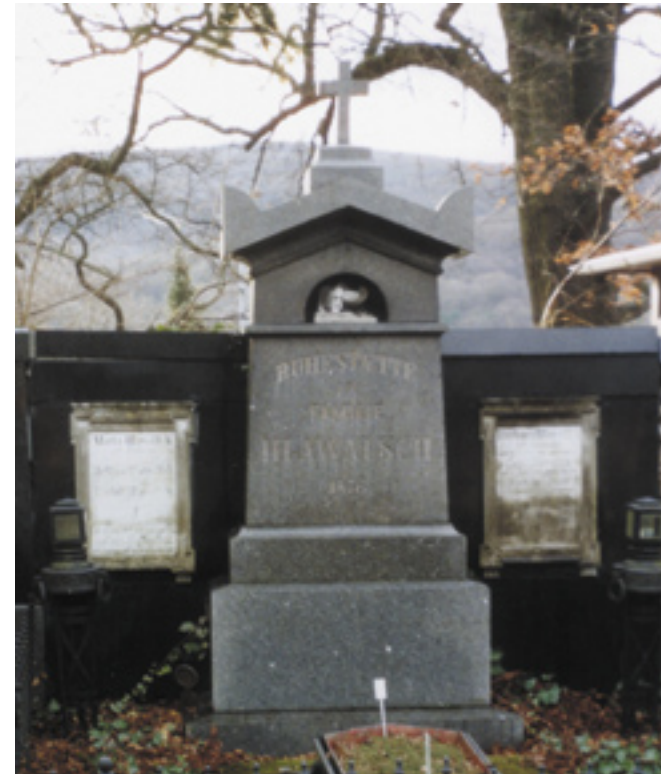
Abb. 3: Grabmal der Gruft N1, G2, Familie HLAWATSCH, Friedhof Hütteldorf in Wien

Anlässlich seiner Versetzung in den Ruhestand im Jahr 1937 wurde ihm vom Bundespräsidenten des Bundesstaates Österreich, Wilhelm MIKLAS, mit Entschließung vom 2. Juli 1937 das "Ritterkreuz des Oesterreichischen Verdienstordens" verliehen.