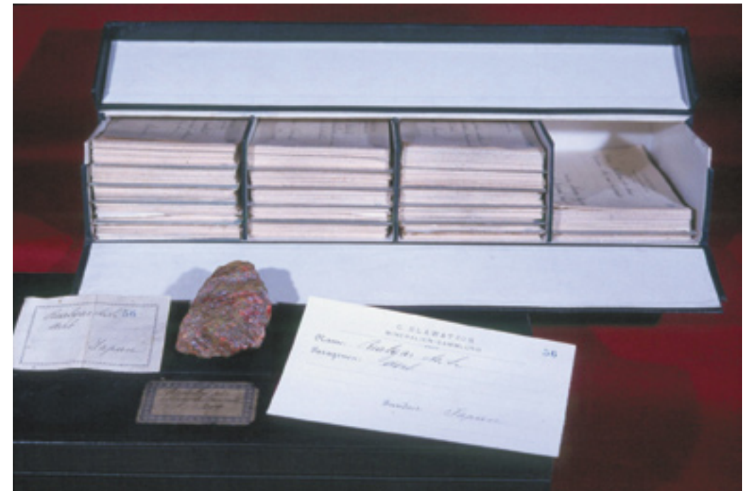
Abb. 4: Zettelkatalog der Sammlung C. HLAWATSCH mit typischer Mineralstufe (Realgar, Nr. 56) aus seiner Sammlung nebst dazugehörigem Inventarkärtchen.

HLAWATSCH setzte sich für sein Labor zum Ziel, einerseits die Hochschulinstitute zu entlasten, andererseits auch für chemische Fabriken und Hüttenbetriebe Analysen durchzuführen. Das erste derartig eingerichtete Laboratorium wurde im Jahr 1914 von einigen Mitgliedern der WMG besucht. Es war mit allen nötigen Behelfen und Instrumenten