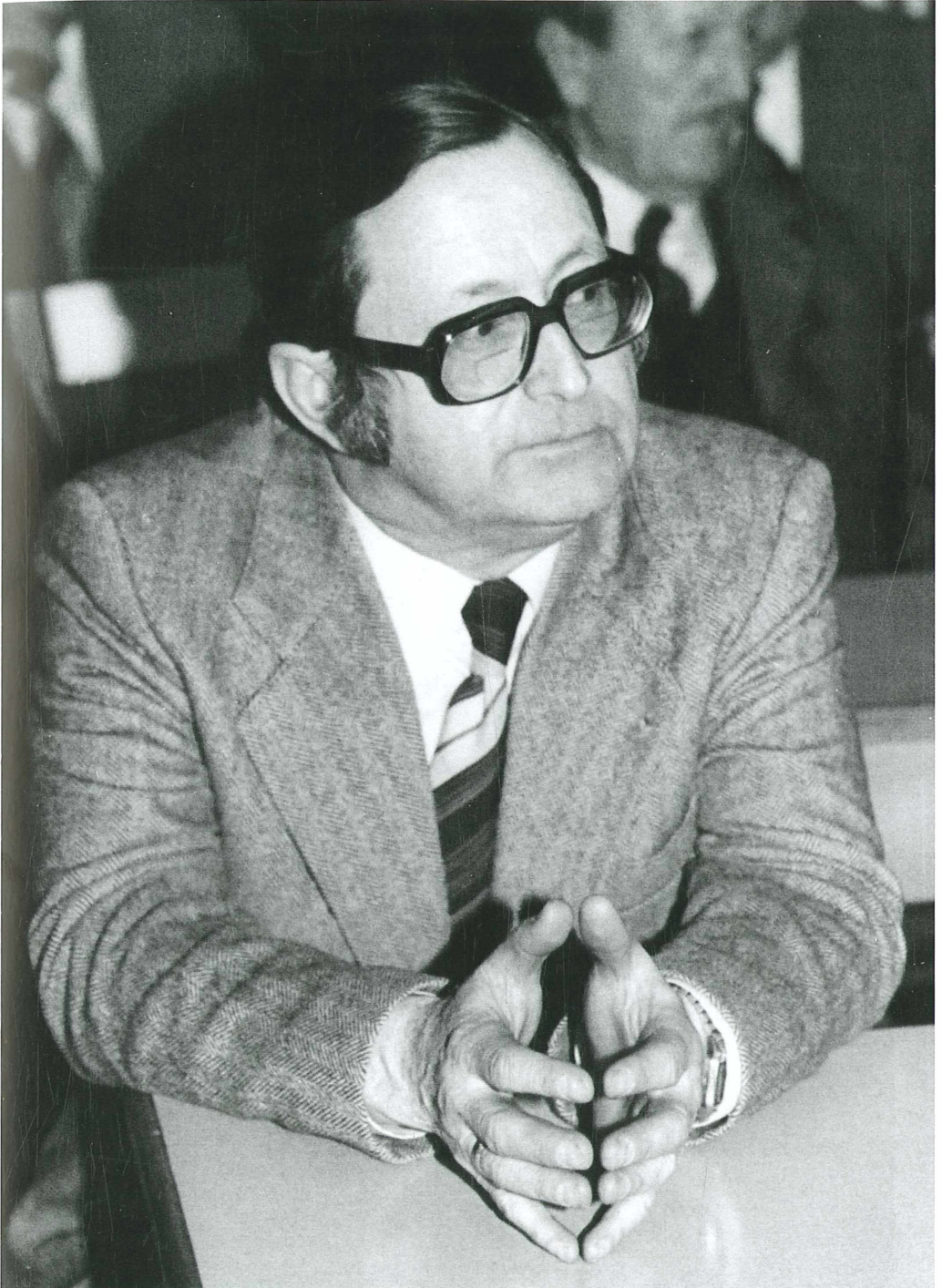
Abb. 4: Teilnahme an einer Tagung um 1980.