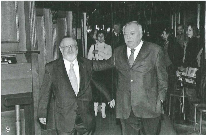
Abb. 6–9: (6) zu Gast bei Bundespräsident Dr. Rudolf Kirchschläger, 21. Jänner 1980; (7) Besuch von BM Dr. Herta Firnberg, 7. März 1982; (8) Besuch von BM Dr. Heinz Fischer, 16. Dezember 1983; (9) Besuch von Bürgermeister Dr. Michael Häupl, 23. November 2007.