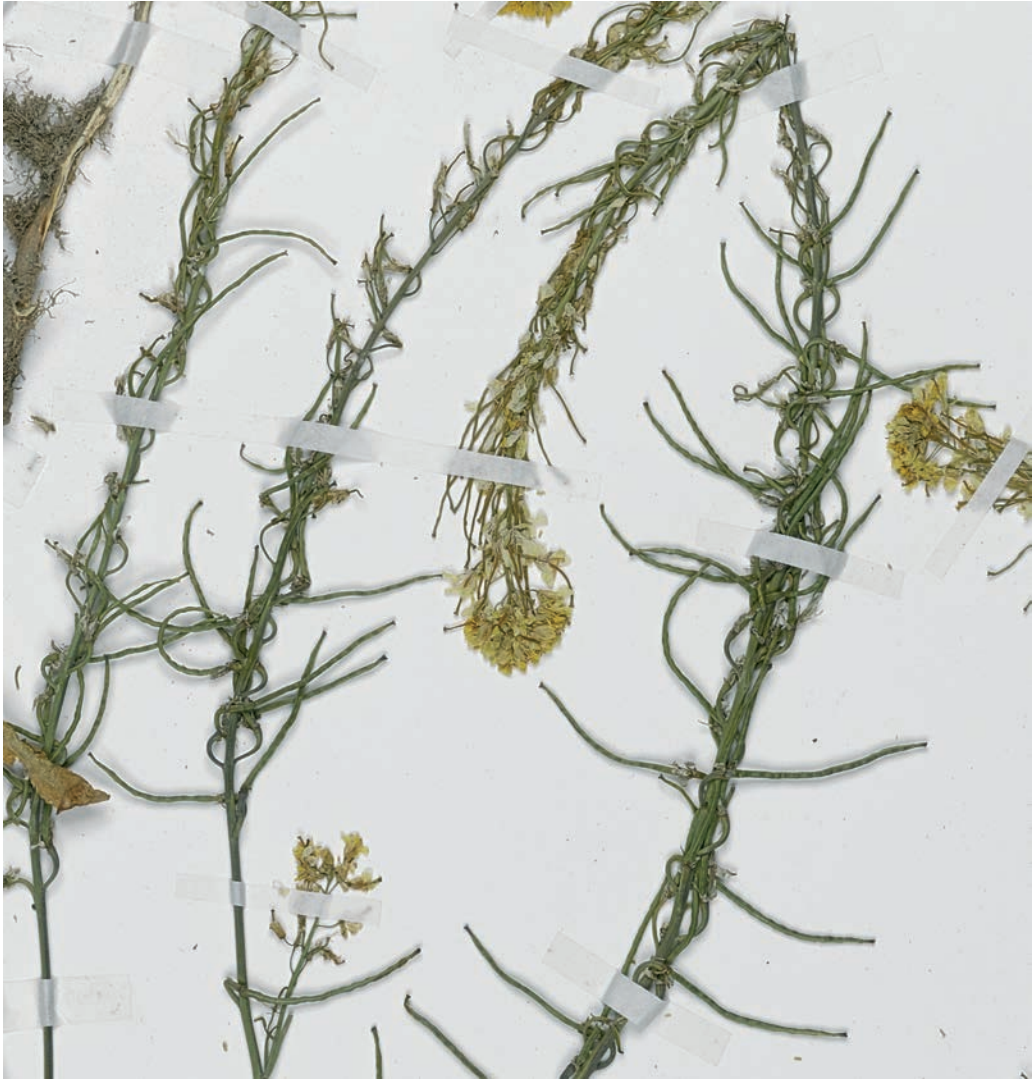
Fig. 4: Sisymbrium pallescens , typischer Fruchtstand, W 2011-0012095.