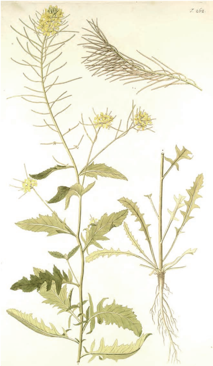
Fig. 2: Sisymbrium austriacum , JACQUIN 1775, Flora Austriaca 3: tab. 262.