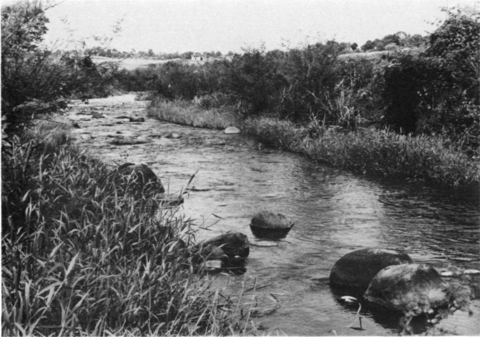
Fig. 5. Basse-Terre: No. 11 (= F/GU/7): Rivière Moustique, cours inférieur au Sud-Ouest de la ville de Petit-Bourg