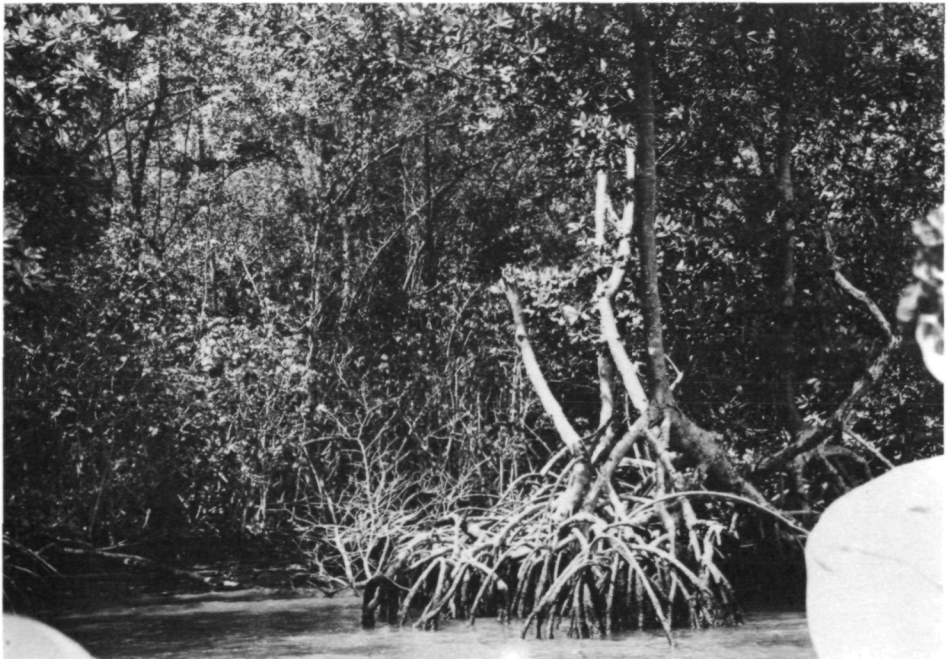
Fig. 6. Basse-Terre: No. 13 (= F/GU/25): Rivière Lézarde, embouchure dans la zone de refoulement de l'eau saumâtre; bordée par des mangroves, marée basse