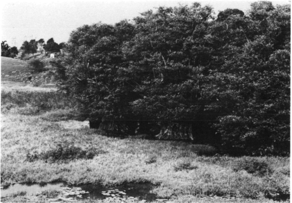
Fig. 9. Grande-Terre: No. 31 (= F/GU/19): Bel Etang, rives marécageuses, surface de l'eau avec des nénuphars, au centre Pterocarpus officinalis