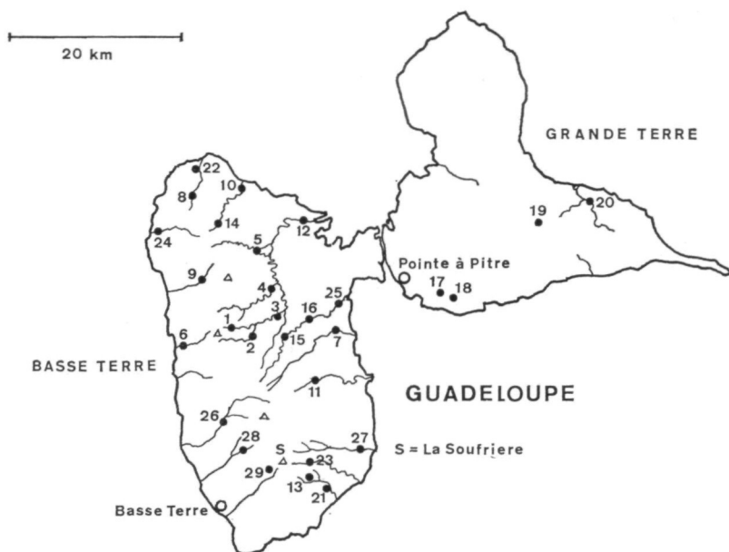
Fig. 2. Carte géographique de l'île-double de la Guadeloupe avec l'île de la Basse Terre et l'île de la Grande Terre

Les numéros figurant sur la carte représentent les stations avec les numéros de collection : (par exemple : 1 = F/GU/1 = No. 1 ou 2 = F/GU/2 = No. 2 dans le texte etc.) Δ indique les sommets de montagnes les plus importants (S = La Soufrière)