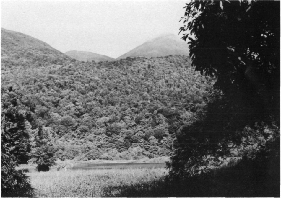
Fig. 8. Basse-Terre: No. 27 (= F/GU/21): Grand Etang, situé en bas de la pente occidentale du volcan de La Soufrière (au fond). Pente avec de la forêt primaire (forêt des pluies)