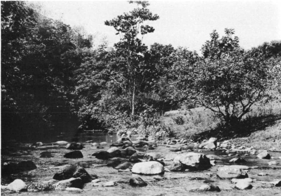
Fig. 4. Basse-Terre: No. 10 (= F/GU/16): Rivière Lézarde, cours moyen près du Chemin de Diane