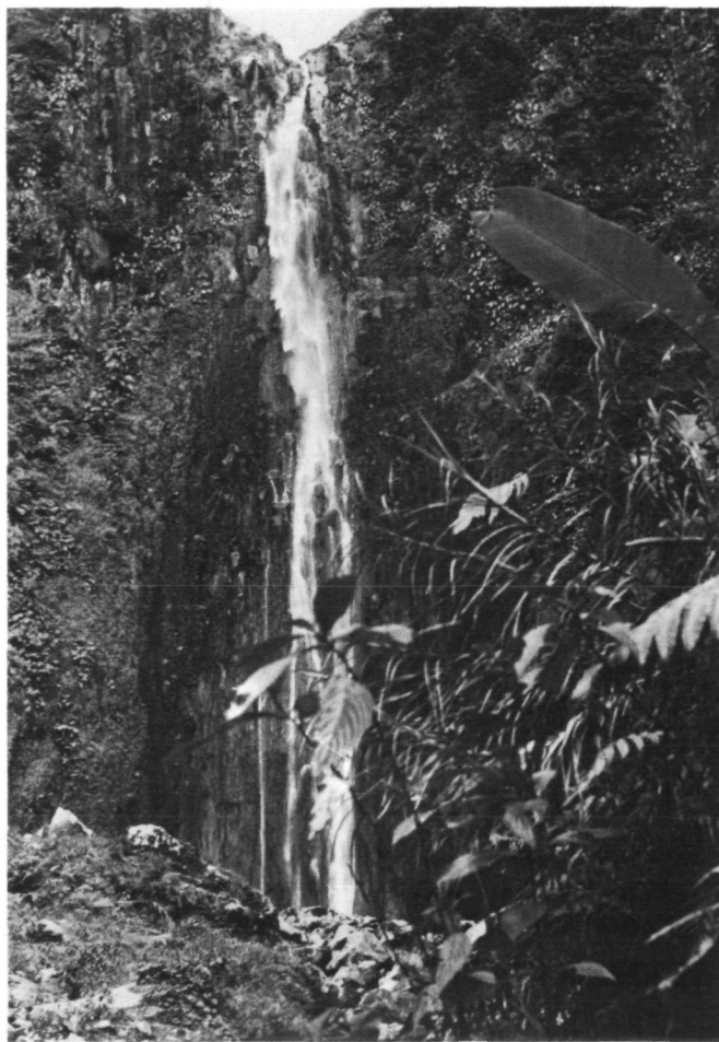
Fig. 7. Basse-Terre: No. 24 (= F/GU/23/I): Chute du Carbet, provenant du massif volcanique de la Soufrière