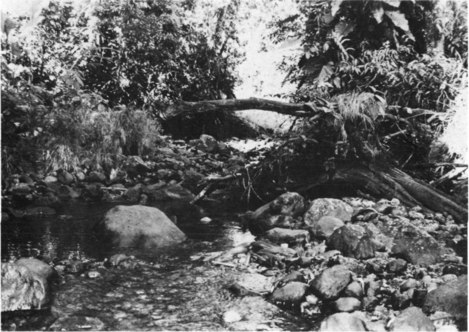
Fig. 3. Basse-Terre: No. 1 (= F/GU/1): Ruisseau de Quiock, affluent du Bras de David, cours supérieur