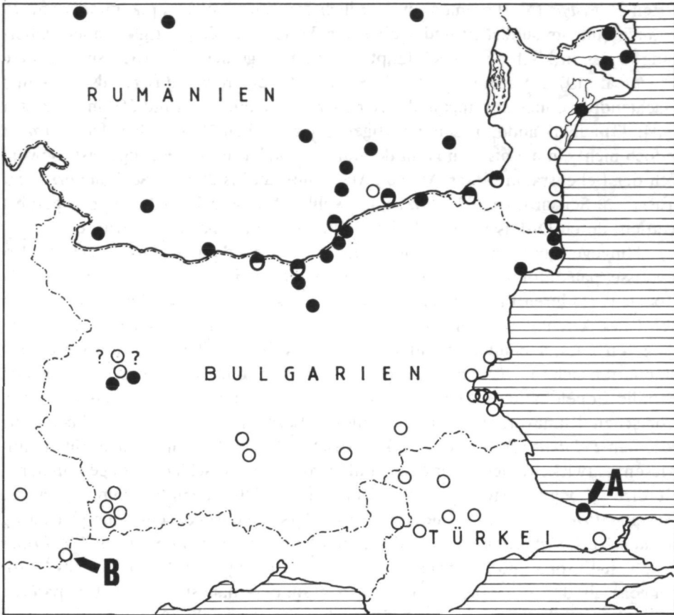
Abb. 1. – Gemeldete Fundorte, Sympatrie (●) und Arealüberschneidung von Pelobates fuscus (●) und Pelobates syriacus (○) lt. MÜLLER 1932, FUHN 1960, BESHKOV & BERON 1964 und ATATÜR & YILMAZ 1986; A = Karaburun, das neu gemeldete Sympatrievorkommen, B = Doiran-See, Terra typica von Pelobates syriacus balcanicus KARAMAN. – Es besteht Diskrepanz zwischen BESHKOV & BERON (1964) und BESHKOV (1984), der die beiden Fundorte nördlich von Sofia zu fuscus zählt. – Überhaupt können genaue Verbreitungsgrenzen derzeit nicht gezogen werden.

Minderzahl gefunden wurde und daß dort (1932: 303) „die nordbulgarischen P. syriacus offenbar in bezug auf ihre Größe etwas hinter den südbulgarischen zurückbleiben“. Es liegt nahe, diese Befunde auf bioklimatische Einwirkungen zurückzuführen: die nördliche Art, P. fuscus , verträgt das südliche Ambiente schlecht, bei der südlichen Art, P. syriacus , ist es genau umgekehrt. So ließe sich vermuten, daß fuscus im Verlaufe ungünstiger Eiszeitverhältnisse weit nach Süden ausgewichen und im Gefolge postglazialer Klimaverbesserung vom rasch nordwärts vordringenden syriacus bis auf kleine Reliktbestände förmlich überrollt worden sein könnte, wobei das querliegende Balkangebirge keine Barriere gewesen wäre (BESHKOV 1984).