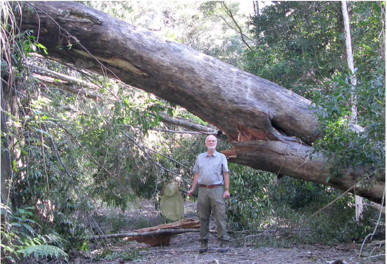
Abb. 8: Die Zygaenen-Jagd in Australien gestaltet sich nicht immer ganz einfach.

I hope that these pictures and memories will help you to start a new decade with travels and new experiences that wait for you! I wish you a very happy birthday!