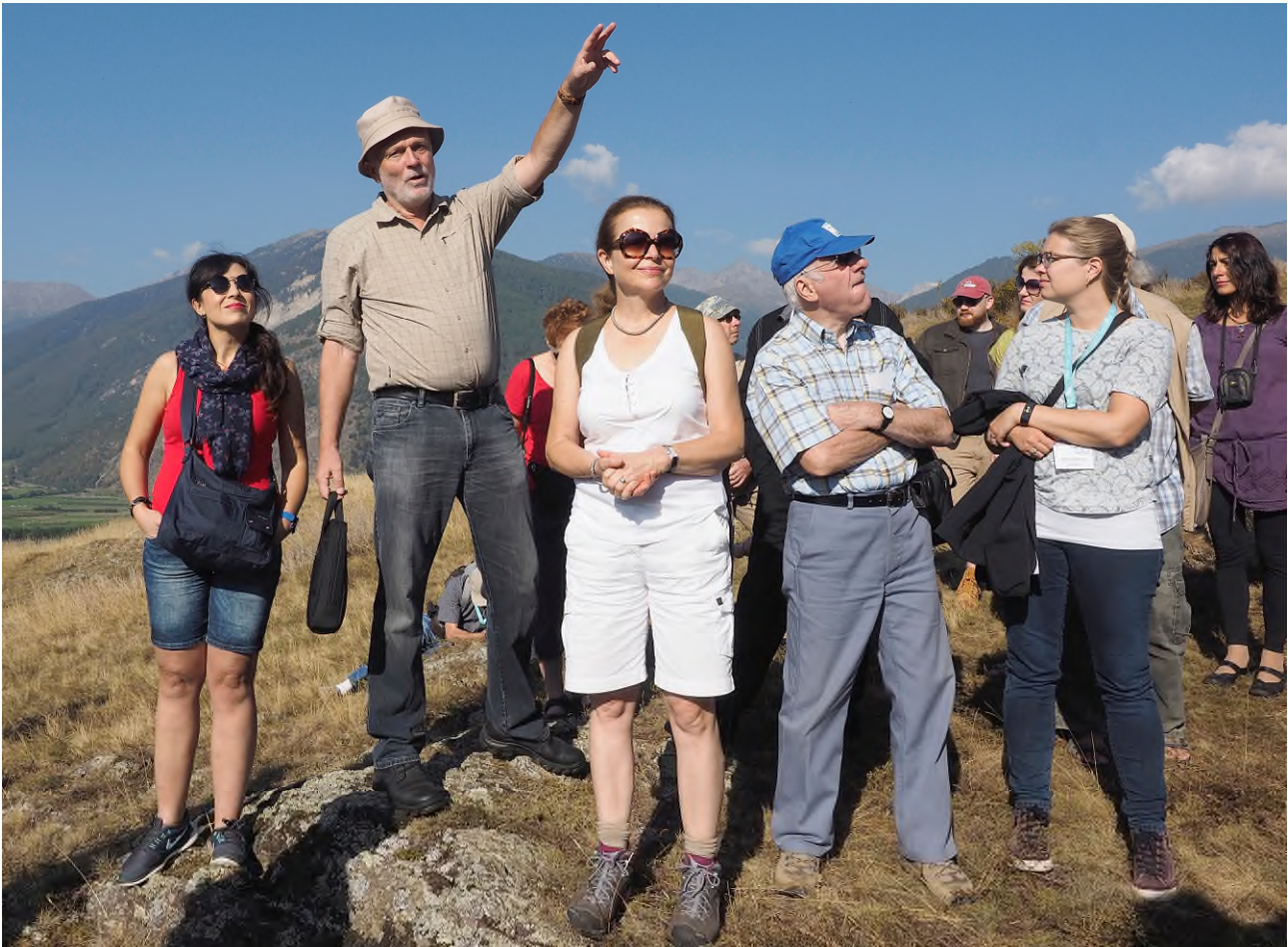
Abb. 4: Gerhard Tarmann im Kreis seiner Fans, anlässlich einer Exkursion in Mals, Südtirol.

nicht hold ist, dann nimmt er es eben selbst in die Hand. Im konkreten Fall mit einem sehr großen persönlichen finanziellen Einsatz, um dieses monumentale Werk doch noch zu einem glücklichen Ende führen zu können.