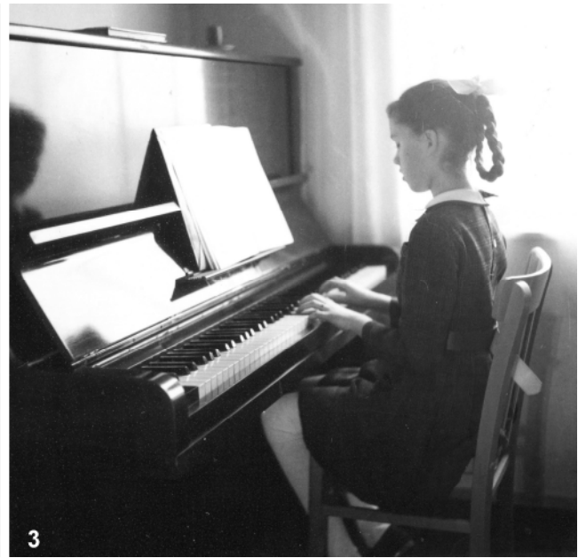
Abb. 2–3: (2) Physikalische Versuche zur Korrelation von Frequenz und Tonhöhe und zum Drehmoment. Der skeptische Blick ist mit zweieinhalb Jahren schon deutlich ausgeprägt. Weihnachten 1954. © Archiv E. Geiser. (3) Das lang ersehnte Klavier! Februar 1962. Die Musik wird ihr lebenslanger Begleiter. © Archiv E. Geiser.

häufig in burgenländischen Wohnungen standen, zogen sie magisch an. So konnte sie ab dem Alter von neun Jahren bis zur Matura das Klavierspielen erlernen (Abb. 3)- Musik ist bis heute ein wesentlicher Bestandteil ihres Lebens und half ihr oft über schwierige Zeiten hinweg. Letzteren Umstand kann ich aus eigener Erfahrung nur bestätigen.