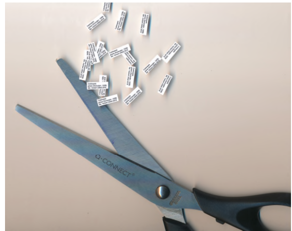
Abb. 10: Richtiges Etikettieren – mit Tipps und Tricks für zeitsparendes Arbeiten. © Herbert Zettel.

Der Vortrag beleuchtete verschiedene grundlegende Fragen des Etikettierens von Insekten, besonders von Trockenpräparaten. Oft werden wichtige Angaben vergessen, weil Forschende sowie Privatsammler und -sammlerinnen nicht bedenken, dass jede gut kuratierte Sammlung irgendwann Bestandteil einer öffentlichen Sammlung werden wird. Es geht jedoch nicht nur darum, was am Etikett vermerkt ist, sondern auch um Fragen, wie man möglichst zeitsparend vorgeht und welche Materialien man verwenden sollte. Auch auf das Verhältnis zwischen Etiketten und Datenbanken wurde eingegangen. Der Vortrag richtete sich insbesondere an Studierende, bot aber auch „Alten Hasen“ (und „Häsinnen“) überlegenswerte Aspekte.