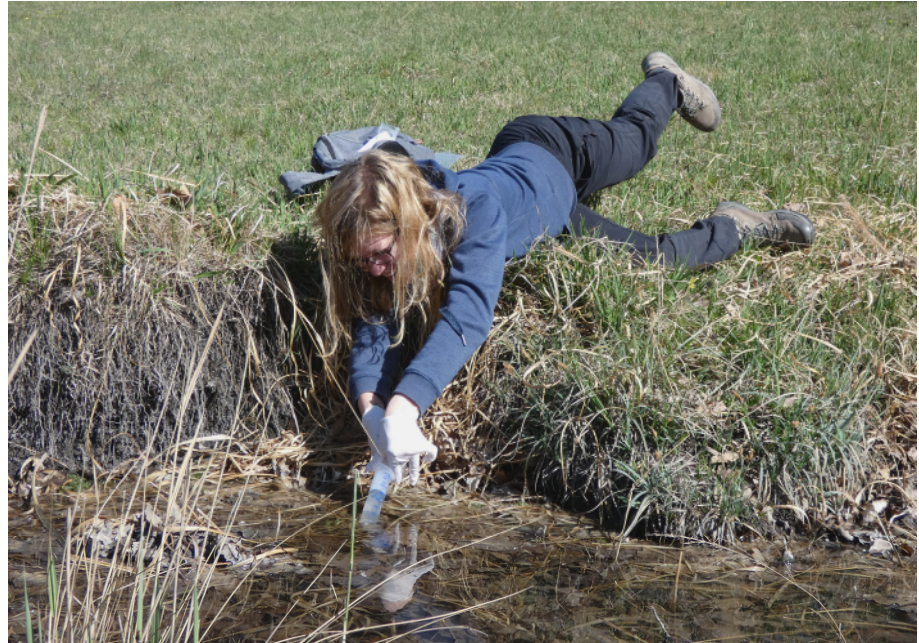
Abb. 9: Für die Wasserprobenahme zum Nachweis von Libellenarten durch Umwelt-DNA-Barcoding sind je nach Uferbeschaffenheit oft unterschiedliche Körperhaltungen gefragt.

und dem landwirtschaftlichen Wasserbau entspringenden Einflüsse stellen die Hauptursachen für die Beeinträchtigungen der heimischen Bäche und Flüsse dar. Während Libellen in Europa im überwiegenden Maß Gegenstand der naturschutzrechtlichen und -fachlichen Forschung sind, finden sie in Österreich auch in der wasserwirtschaftlichen Praxis Einsatz. Die angewandten Methoden wurden hierzulande entwickelt und entsprechen den Anforderungen der EU-Wasserrahmenrichtlinie hinsichtlich einer gewässertyp-spezifischen Bewertung (Abb. 8; CHOVANEC 2019a, b, 2021a). So wurden beispielsweise zahlreiche Rückbaumaßnahmen in Ober- und Niederösterreich sowie in Wien durch libellenkundliche Studien bewertet. Beispiele dafür sind in der Literatur am Ende des Beitrages angeführt. Auch im derzeit laufenden LIFE-Projekt „Integrated River Solutions in Austria“ ( https://life-iris.at/ ) werden Odonata zur Beurteilung des ökologischen Zustandes herangezogen.