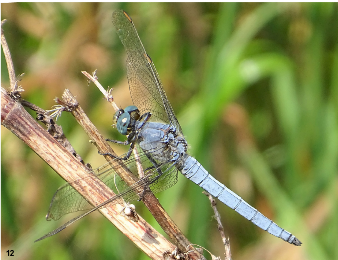
Abb. 11–12: (11) Die Männchen des Kleinen Blaupfeils ( Orthetrum coerulescens ) weisen in Mitteleuropa üblicherweise einen bräunlichen Thorax auf. (12) Der hellblau bereifte Thorax dieses Exemplars wird als Anpassung an die erhöhten Temperaturen interpretiert.