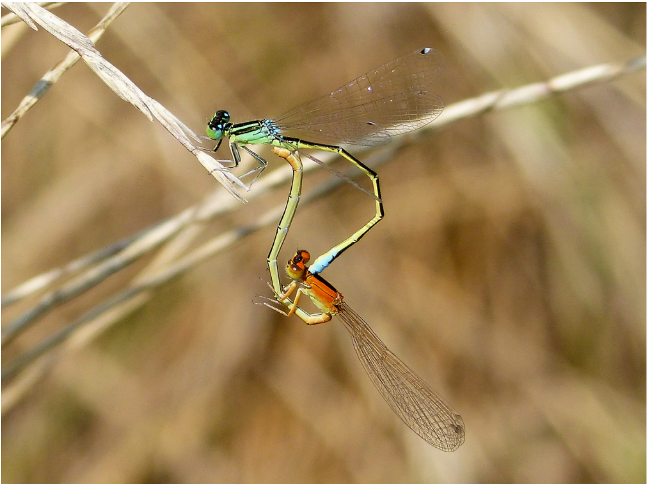
Abb. 13: Paarungsrade aus einem reifen Männchen und einem noch unreifen Weibchen der Kleinen Pechlibelle. Es wird angenommen, dass das Weibchen die Spermien bis zur Geschlechtsreife speichert, um bei der Eiablage an einem möglicherweise neu besiedelten Gewässer von der Anwesenheit von Männchen unabhängig zu sein. Die Art ist durch einen starken Pioniercharakter gekennzeichnet.

Jahrzehnten verstärkt an Fließgewässern realisiert wurden. Die Larven leben in sandig-kiesigen Substratfraktionen, die in regulierten Bächen und Flüssen nicht abgelagert werden. Unklar ist allerdings, welche Auswirkungen die klimawandelbedingt erhöhten Wassertemperaturen auf diese Arten haben werden.