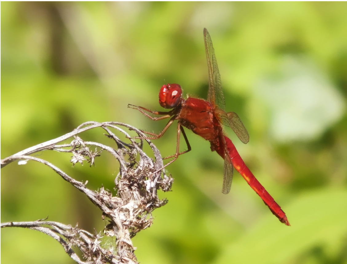
Abb. 10: Die Westliche Feuerlibelle ( Crocothemis erythraea ) wurde im Zusammenhang mit den Folgen des klimawandelbedingten Temperaturanstieges zu einer ikonischen Art.

grenze der ursprünglich afrikanisch-mediterran verbreiteten Westlichen Feuerlibelle, Crocothemis erythraea BRULLÉ, 1832, durch Österreich. Beobachtungen dieser Art stellten zu dieser Zeit eine „Sensation“ dar (Abb. 10). Dreißig Jahre später gehört diese Spezies zum etablierten heimischen Inventar häufig vorkommender Libellenarten und wird auch nördlich Österreichs bis in den Süden Englands gefunden.