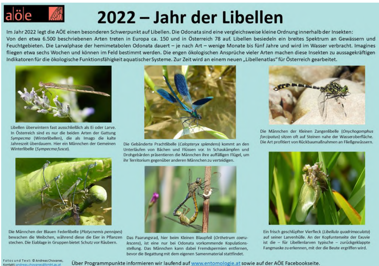
Abb. 1: Das Poster der AÖE zum Jahr der Libellen mit Bildern von Andreas Chovanec.

Im Jahr 2022 standen Libellen (Odonata) im Zentrum der Aktivitäten der Arbeitsgemeinschaft Österreichischer Entomologen (AÖE). Im Jahr davor lag der Schwerpunkt auf den Wildbienen. Unter dem Schirm der Libellen wurden ein Workshop, Vorträge und Exkursionen abgehalten. Traditionellerweise wurde der Tiergruppe des Jahres auch ein Poster gewidmet (Abb. 1). In den in Deutschland veröffentlichten „Libellennachrichten“, den Mitteilungen der Gesellschaft der deutschsprachigen Odonatologen (GdO), wurde ein Beitrag zum österreichischen „Jahr der Libellen“ herausgebracht (CHOVANEC 2022a).