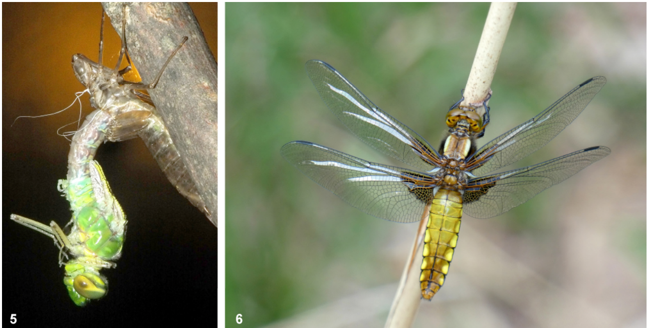
Abb. 5–6: (5) Bei der Großen Königslibelle, Anax imperator LEACH, 1815, erfolgt der Schlupf im Schutz der Nacht. In der Morgendämmerung startet die geschlüpfte Imago zu ihrem Jungfernflug. (6) Ein immatures Weibchen des Plattbauchs, Libellula depressa LINNAEUS, 1758. Gut zu erkennen sind die noch nicht vollständig ausgehärteten, glasig wirkenden Flügel.

ohne die Sammlung der im Wasser lebenden Larven durchführbar, was aus der Sicht des Artenschutzes vorteilhaft ist. Am leichtesten sind die fortpflanzungsaktiven Imagines am Reproduktionsgewässer nachzuweisen.