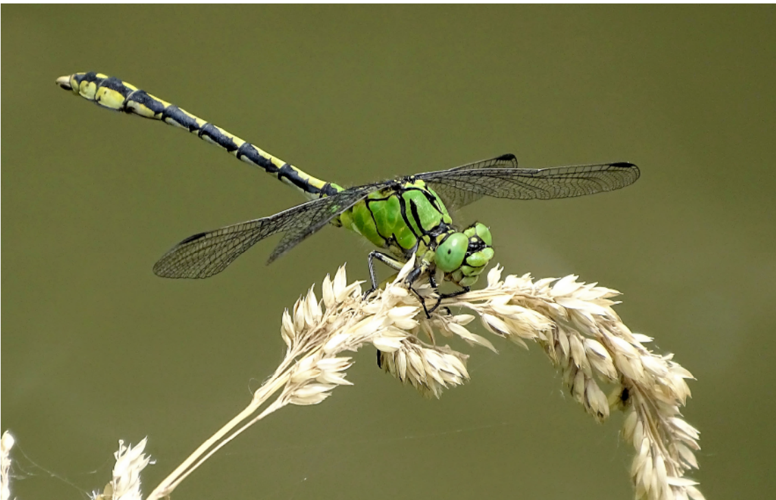
Abb. 8: Die strömungsabhängige, an naturnahen Fließgewässern auftretende Grüne Flussjungfer, Ophiogomphus cecilia (FOURCROY, 1785), ist eine aussagekräftige Zeigerart im Rahmen wasserwirtschaftlicher Bewertungen und als Spezies, die in den Anhängen II und IV der Fauna-Flora-Habitat-Richtlinie angeführt ist, auch von naturschutzrechtlichem Interesse.