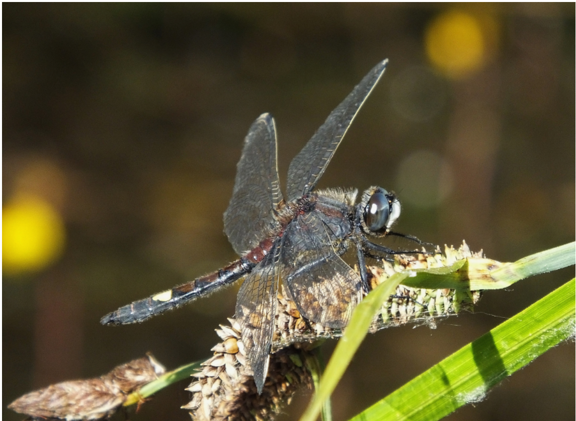
Abb. 14: Ausgefärbtes Männchen der Großen Moosjungfer. Nach dem Schlupf haben junge Männchen auf den Abdominalsegmenten 2–7 eine ausgedehnte gelbe Zeichnung. Von diesen behält nach der Reifung jedoch nur der Fleck auf dem siebenten Segment seine helle Farbe. Die Flecken der anderen Segmente werden zunehmend dunkler bis sie, wie bei dem abgebildeten Tier, rotbraun gefärbt sind.

oder Räuber vorkommen. In der heutigen Kulturlandschaft ist die Kleine Pechlibelle an warmen, sonnenexponierten flachen Weihern, mit Wasser gefüllten Fahrspuren, Lehm- und Kiesgruben, Entwässerungsgräben, als auch moorigen Gewässern anzutreffen. Stabile Populationen sind oft von kurzer Dauer; mit zunehmender Sukzession verschwindet die Art nach wenigen Entwicklungsperioden wieder (CHOVANEK 2022b).