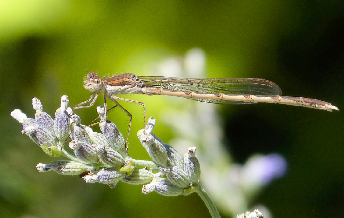
Abb. 7: Männchen der Gemeinen Winterlibelle, Sympecma fusca (VANDER LINDEN, 1820), auf Lavendel. Winterlibellen sind die einzigen mitteleuropäischen Odonata, die den Winter als adulte Tiere verbringen. Nach ihrem Schlupf im Juli/August verlassen sie das Gewässer, um zu reifen und Überwinterungsplätze zu suchen. Im folgenden Jahr sind sie die ersten Libellen am Gewässer. Geschlechtsreife Tiere erkennt man an ihren blau gefärbten Augenkuppen. Das Tier auf der Abbildung wurde vor der Überwinterung fotografiert und hat deshalb noch bräunlich gefärbte Augen.