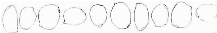
C. spec. (lilatinctus)